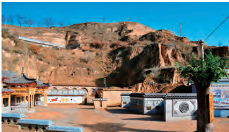
子洲县孝文化展览馆

展馆是子洲县践行社会主义核心价值观学习基地、爱国主义教育基地、文化艺术联合会见习基地和陕北文化研究会研究基地。