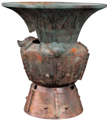
商代兽面纹铜尊（2010 年裴家湾镇官王岔村出土）

子洲县庙宇、乐楼等古建筑甚多。三川口镇楼儿坪村的洪济寺，创建年代很早。现存有明洪武年间重修碑记，明弘治《延安府志》对这座庙宇也有记载。每年农历四月四日庙会，香火鼎盛。位于县城西 2.5 千米的大洪寺，是很著名的庙宇。农历三月十八日和七月八日有庙会。该庙宇布局合理，颇为壮观。可惜“文化大革命”中遭毁，只保留正殿拱形窑。近年重建，颇具规模。瓜园则湾的柏全山，树木葱郁，庙宇巍然。寺院坐北面南，占地约十亩，主奉天皇伏羲、地皇神农、人皇轩辕三皇大帝。寺院布局层次分明，殿阁错落有致，有泥塑神像 50 余尊，有的狰狞，