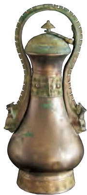
商代带盖提梁卣（2010 年裴家湾镇官王岔村出土）

村出土的陶瓮，周家砭镇董家圪塔村出土的陶罐。有泥质陶、细泥陶烘成的陶碗、陶钵，如李孝河村出土的龙山文化时期的椭圆形陶碗，老君殿镇刘家源出土的陶甗。有约 5000 年之前属于仰韶文化时期的汲水器，三川口镇毕家砭出土的小口尖底瓶，还有在陶坯上画出黑色花纹或彩色花纹然后烧制的彩陶。另外，还出土有商、周青铜器和战国、秦、汉时期的铜器、铁器、陶器及汉画像石等。