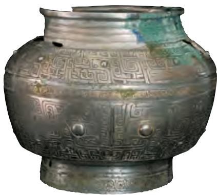
商代兽面纹铜罍（2010年裴家湾镇官王岔村出土）

子洲县有省级重点文物保护单位两处、市级3处、县级23处，省级非物质文化遗产项目1个、市级12个、县级30个。