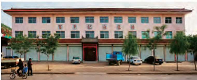
周家硷百年记忆展览馆

2012年8月30日建成开馆，位于县城西30千米处大理河畔的周家硷镇。周家硷镇是陕北名镇，历来以交通孔道、商旅繁盛、人文荟萃著称，更有“秦晋通都”之美誉。展览馆建在周家硷中学综合办公楼，面积860平方米，收藏实物、图片3000多件（幅），分为商贸、餐饮、文卫、教育、农业、手工业、交通运输、家居用品、农家生活、人物等十个展室，集中展示了周家硷镇百年来在农耕、商贸、教育、文化、生活、民俗等方面的发展、变迁。展览馆生动再现了农耕时代陕北黄土高原的风土民情，是子洲县人文民