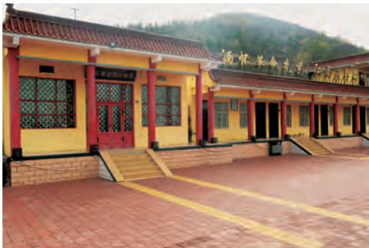
马文瑞生平事迹图片展览馆

工作经历，及其卓著的历史功绩和崇高的革命风范。展览馆是介绍马文瑞生平事迹的传记性展馆，也是子洲县廉政警示教育和榆林市青少年爱国主义教育基地。