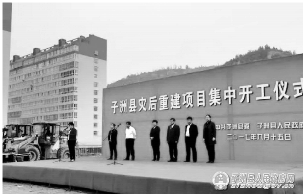
重建项目集中开工

面对灾后的困境,子洲人民在中共子洲县委的领导下,在子洲县人民政府的指挥下,用最短的时间恢复了电力、通信、道路等城乡基础设施,用最短的时间清理了县城淤泥,恢复了县城基本功能。在各级政府和社会各界的大力支持下,用最短的时间寻找短板,重新规划,启动了灾后重建,书写了抗洪抢险与灾后重建的“子洲速度”。