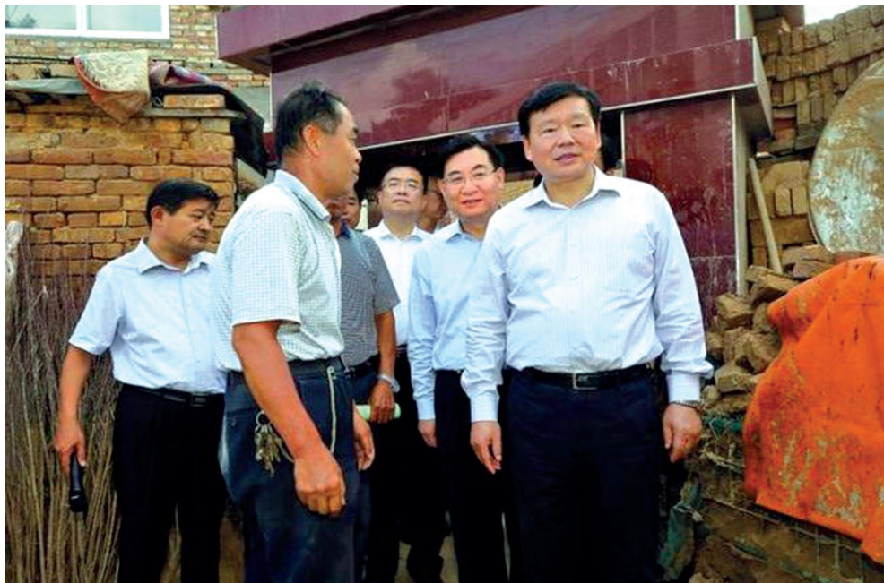
8月18日，省委书记娄勤俭（右一）、省长胡和平（右二）到遭受严重洪涝灾害的子洲县张家寨村村民张海林家了解灾后重建情况。