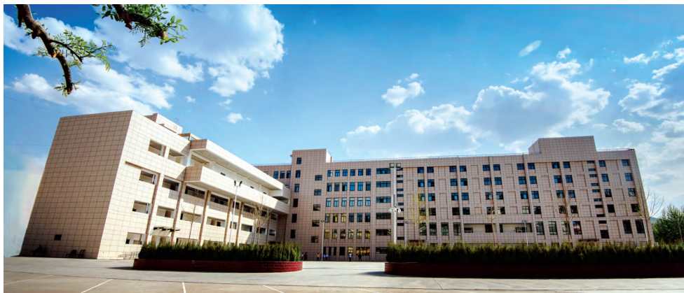
子洲二中扩建工程