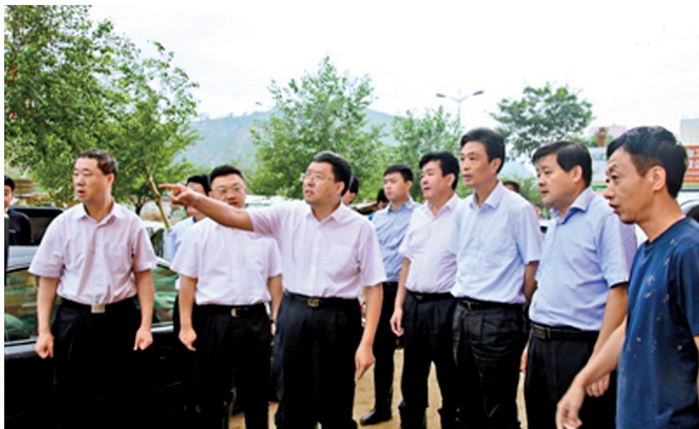
7月27日，省委副书记毛万春（左三）在子洲县城查看灾情，指导救灾。