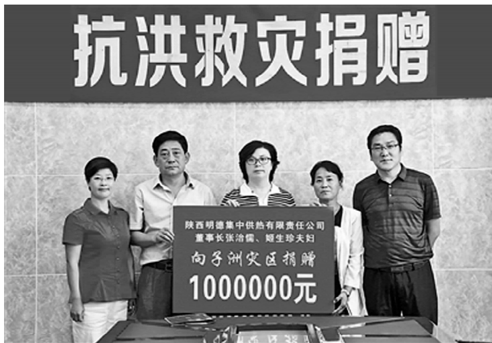
政府代表接受捐款

灾情发生后，党中央、国务院高度关注，时任中共中央政治局常委、国务院副总理张高丽，时任国务院副总理汪洋，分别对抢险救援作出批示；国防总副总指挥、水利部部长陈雷对防汛防洪工作提出明确要求；陕西省委、省政府领导先后作出指示，并亲自到灾区调研指导灾后重建，市委领导也多次来到子洲现场办公，协调解决问题，慰问受灾群众；国防总、民政部和省市有关厅局、在榆国企、省企负责人都来到现场指导抢险救灾工作。