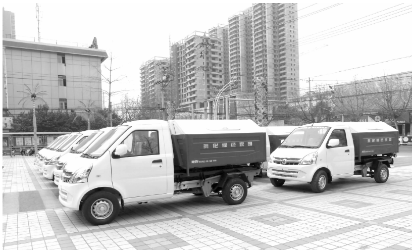
送车(垃圾转运车)下乡

2014 年,市电力局管理 10 千伏线路 51 条 847.679 公里,0.4 千