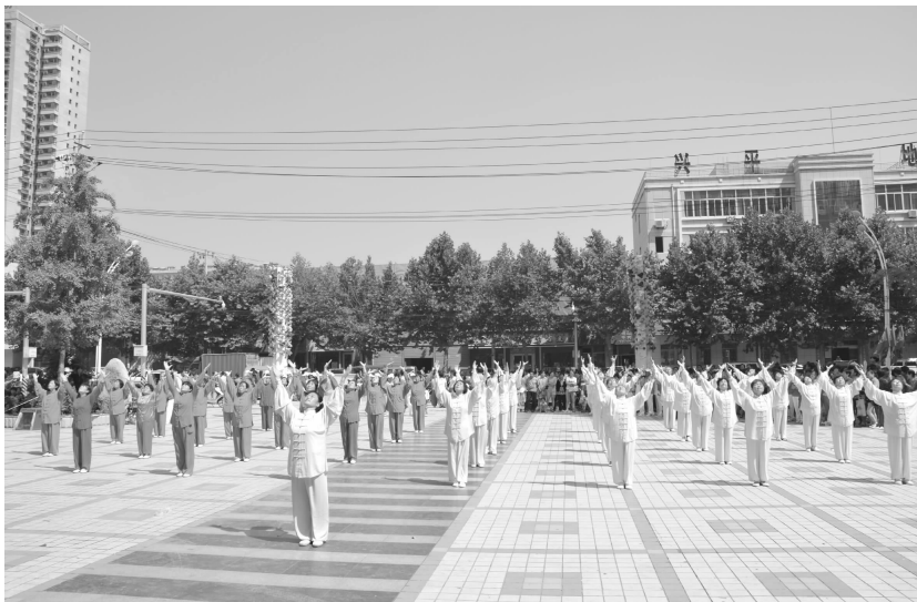
全民健身日文体活动展演

产日”文化宣传等一系列文化演出活动。组织庆三八老年门球赛、迎五一健步走活动、喜迎国庆、欢度重阳离退休干部文艺汇演、老年书画展和老年人文化养老周慰问演出活动。③群体活动。8月8日,开展全民健身日文体展演活动,并表彰11名全民健身先进集体。协助财政局、人社局、卫生局举办职工趣味运动会。组织开展“腾达佳源杯”广场舞大赛、“三秦书月·书香兴平”系列活动。