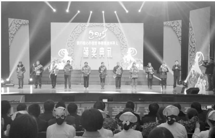
“践行核心价值观 争做最美兴平人”颁奖典礼

行为“十要十不要”传单近2万份，倡导市民结合日常生活、工作，从自身做起、从小事做起，遵法守纪。⑧及时更新、充实文明网站内容，全年发送动态信息123条。