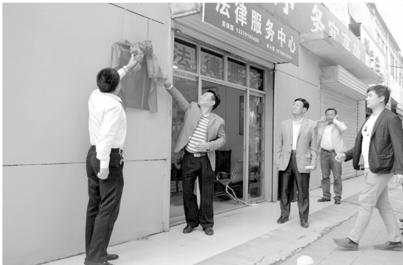
市信访局法律服务中心揭牌仪式

【制度完善】 针对重点领域突出信访问题频发的现状,由局主要领导牵头组成多个调研小组,对新时期信访工作改革、信访听证评议、信访积案化解等重点信访工作分解落实调研任务,并邀请离退市领导带队参与信访调研活动。通过调研出台《兴平市市领导接访约访下访工作制度》《兴平市关于进一步规范信访事项受理办理程序引导来访人依法逐级走访实施细则(暂行)》《关于处置市级机关门前非正常访的实施意见》,参与制定《兴平市重大项目重点工作督查问责办法》等兴平信访工作指导性文件,完成《信访积案化解存在问题及建议》《全市信访现状分析研究与对策》等调研报告3份,郭军科撰写的《多措并举求实创新