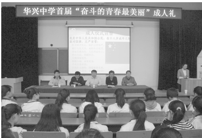
“奋斗的青春最美丽”成人礼

【青年志愿者行动】 2月份, 组织城市应急救援服务队进社区开展自护教育宣传活动; 3月份, 组织全市各系统的百余名志愿者开展清洗街道护栏、便民服务等集中志愿服务活动, 摆放各类宣传展板及挂图30余块(张), 发放各类宣传资料500余份, 服务群众200余人次; 植树节, 组织50余名志愿者开展植