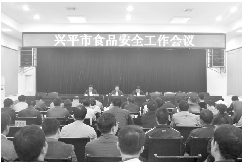
召开全市食品安全工作会议

户,C级店448户。②开展学校、托儿所、幼儿园、建筑工地,企事业单位食堂专项整治活动,检查135户(从业人员854人)下发整改通知42份,查处并销毁问题食品28公斤,责令停业整改2家。③开展肉、肉制品和“地沟油”废弃油脂处置专项检查整治活动,检查整治368户,督促餐饮单位与餐厨垃圾回收人签订废弃油脂处置协议书103份;出动执法人员560人次,车辆175台次,检查餐饮服务单位586户次,其中重点检查火锅店72家,包子饺子店和泡馍馆54家,麻辣烫涮菜店36家,查处无标识的食用油30公斤并现场予以销毁,查处问题肉品17公斤。④在城区及近郊包括马嵬驿旅游景区,烧烤园、农家乐进行为期1月的专项整治,检查81家,下发限期整改通知书11户,办理健康证287人,查出过期、无标识食品、调味品15瓶,变质海蜇、问题牛羊肉10公斤。