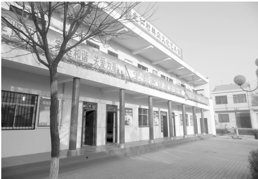
西城办北仁村幸福互助院

年各项工作任务。全市农业总产值完成 38.5 亿元,农民人均纯收入 10936 元。