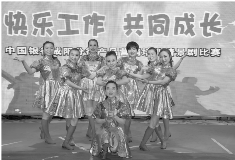
中国银行咸阳分行产品营销培训情景剧比赛

【企业文化】 ①深入厂区、学校、社区等人口集居区,开展一系列金融知识宣传活动,散发宣传单近万份。②举办“服务礼仪与业务技能风采展示”活动。年内收到 95566 客服表扬工单 53 起,群众表扬信 16 封,锦旗 5 面。③在兴平市服务