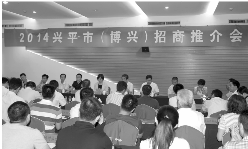
积极筹备并召开 2014 兴平市(博兴)招商推介会

【招商引资活动】 ①3 月 5 日至 8 日,由市长苏晓梅、副市长吴凯带队,赴北京、天津、青岛等地开展专项投资促进活动,考察浩丰(青岛)食品有限公司、北京泛能动力技术开发有限公司、修正集团、天津东大伟业酱菜食品有限公司等企业,就有机蔬菜种植基地和生产加工基地项目、液化天然气装置生产项目、高分子塑钢材料生产项目、豆