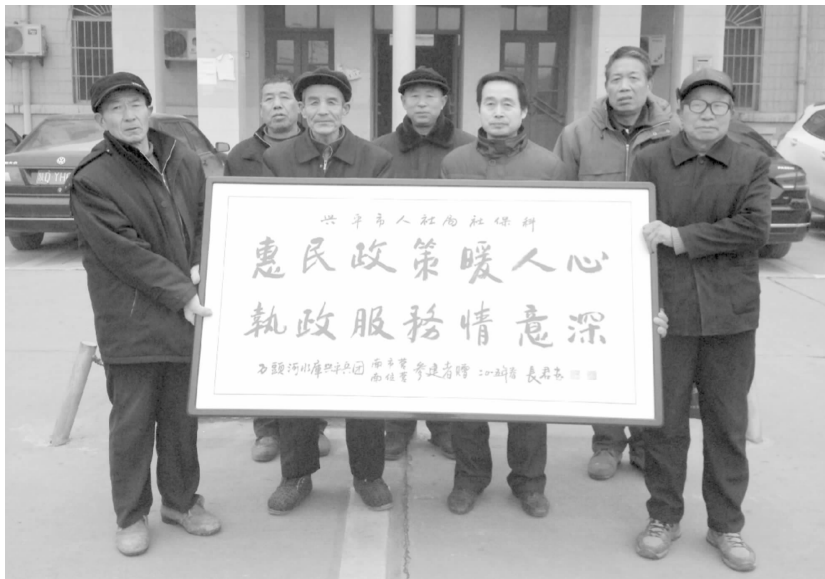
群众为社保科赠送牌匾

【社会保障体系建设】 2014年,全市城乡居民养老保险累计参保23.9万人,完成年目标的109%;基本医疗保险累计参保130934人,完成年目标的106.5%。基金征缴13416万元,完成年任务的102.5%。失业保险新增参保1045人,完成年任务的123%;基金征缴2089万元,完成年任务的104.5%。工伤保险累计参保56091人,完成年目标的107.8%;基金征缴1415万元,完成年任务的163.4%;完成全市事业单位干部职工工伤参保工作。生育保险累计参保29283人,完成年任务的106.4%;基金征缴627万元,完成年任务的156.4%。对曾在陕西省城镇国有、集体企业及事业单位工作满3年以上的城镇户籍1311人、农业户籍9292人办理了养老保险参保及到龄退休手续。为200多名“两参”(参战参试部队的军人)人员办理档案托管和城镇职工养老保险。办理城乡居民养