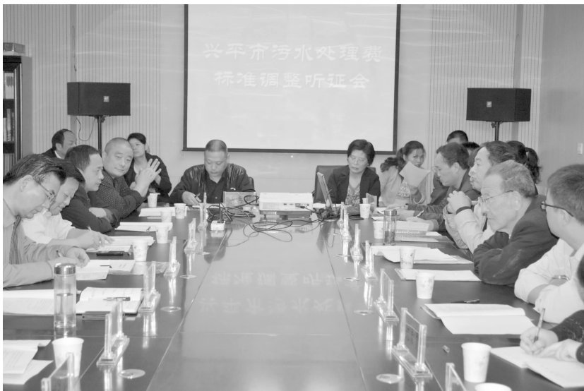
召开污水处理费标准调整听证会

【价格检查】 ①元旦、春节、五一、清明、端午、国庆期间,检查整顿粮、油、肉、蛋、奶、菜、药品等居民生活消费必需的7大类商品。检查全市8家大型购物超市、52家药店、6家粮油店、23家有代表性的经营户的商品价格和明码标价情况,并将每周三定为“市场巡查日”,对部分明码标价政策执行不到位的商户进行批评教育和政策宣传。②3月和10月进行春、秋两季教育收费工作检查,检查高级中学6所,初级中学18所,乡镇教委11个,农村小学45所,各学校均能按要求进行价格公示并按标准收费。但仍存在个别学校超标准招收择校生、收取补课费、资料费等违规情况,责令其将违规收取的费用全额退还给学生,并按照规定处罚5.97万元。③5月份,开展医疗药品价费专项检查。对乡镇卫生院、营利性医疗机构和村级卫生室的价格执行情况专项检查。检查二级医院6所,社区服务中心和乡镇卫生院、地段医院18所,处理个别卫生院收费不规范,药品价格虚高,不执行药品最高限价,超标准收费等,实行经济制裁5.82万元。④8月份,开展涉农价格及收费专项检查,对