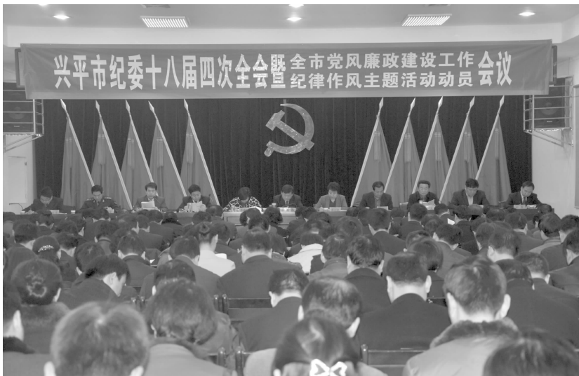
兴平市纪委十八届四次全会

规定典型案例》《落实中央八项规定制度汇编》《陕西省通报的违反中央八项规定精神典型案例》等读本,为各部门、各单位贯彻中央八项规定提供依据。②开通手机廉政短信服务平台,坚持定期发送和重大节假日提醒相结合,向科级以上领导干部发送手机廉政短信10000余条。③出台《廉政文化“六进”工作标准》等规范性文件;举办全市科级干部“贤内助”培训班和廉洁家庭签名活动;成功承办“廉政文化三秦行走兴平”活动;创建市政府大院、市工商局、东城办西南社区、南郊中学等一批廉政文化示范点;在电视台和城区街道广告显示屏上滚动播出廉政公益视频;在兴平廉政网开设党风廉政建设“两个责