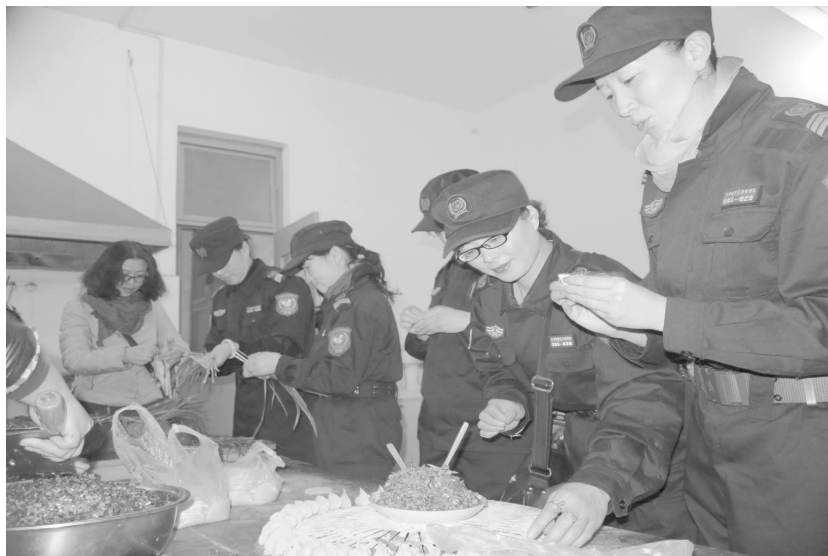
兴平市青年志愿者城市应急救援队在市敬老院为老人包饺子