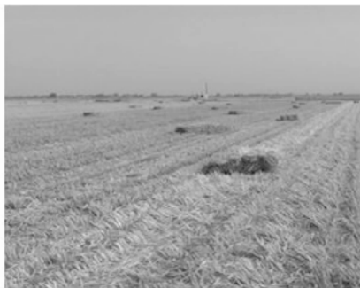
汤坊镇三夏期间推广捡拾打捆机现场照片

【城镇化建设】 推进镇办驻地小城镇建设,新安装太阳能路灯 30 盏,安装健身器材 40 件(套),修补街道 2 公里,硬化广场 1000 平米,新建文化墙 100 米。对镇街道商业门店统一规划,投资 10 万余元,清运辖区内的垃圾。道路建设抓续建、抓管护,投资 130 万元重修五龙路 2.5 公里。完成民政部门幸福养老院建设项目,总投资 7 万元,建成总占地 72 平方米,容纳 10 人的住宿场所、棋牌室、餐厅和厨房。