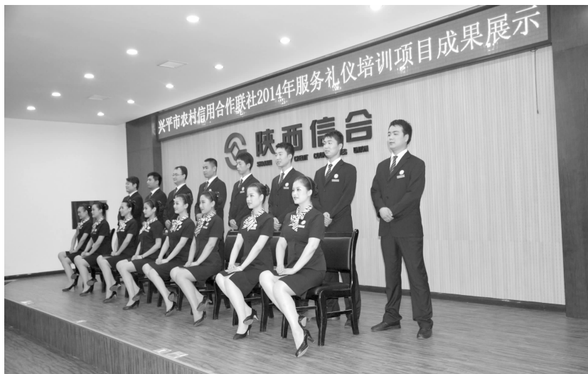
服务礼仪培训成果展示

开展金融知识进万家活动,全年组织宣传 30 余次,接受群众咨询 6000 余人,发放宣传折页 48000 份。②先后冠名赞助共青团兴平市委举办的“牵手春天,缘来是你”首届“信合杯”大型青年交友联谊会、兴平文体广电局举办的“信合杯”群星风采·首届咸阳市群文系统业务干部技能大赛暨全市社会文化艺术人才选拔大赛。③创办《信合之窗》期刊,开通兴平信合微信平台,提倡“家文化”,树立“快乐工作,幸福生活”理念。④印发《责任比能力更重要》《大数据时代》等书籍 275 册。⑤举办演讲比赛、职工羽毛球比赛、职工生日联欢晚会、职工拓展训练等主题活动 8 场。⑥为高考录取的职工子女发放助学金 20000 余元。