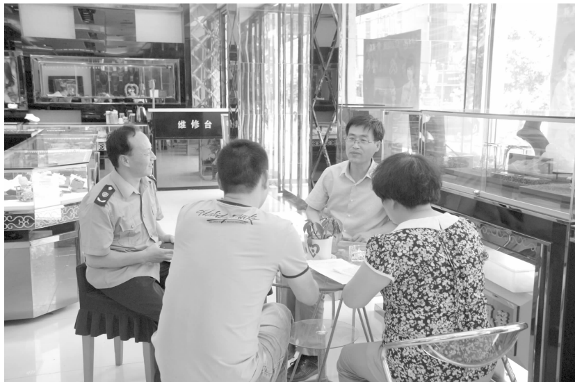
开展党的群众路线征求意见活动

育实践活动,较好地完成了全年各项工作任务。被陕西省工商局评为全省工商系统依法行政先进单位;被咸阳市工商局评为目标责任考核优秀单位;被陕西省爱国卫生委员会评为省级卫生先进单位。