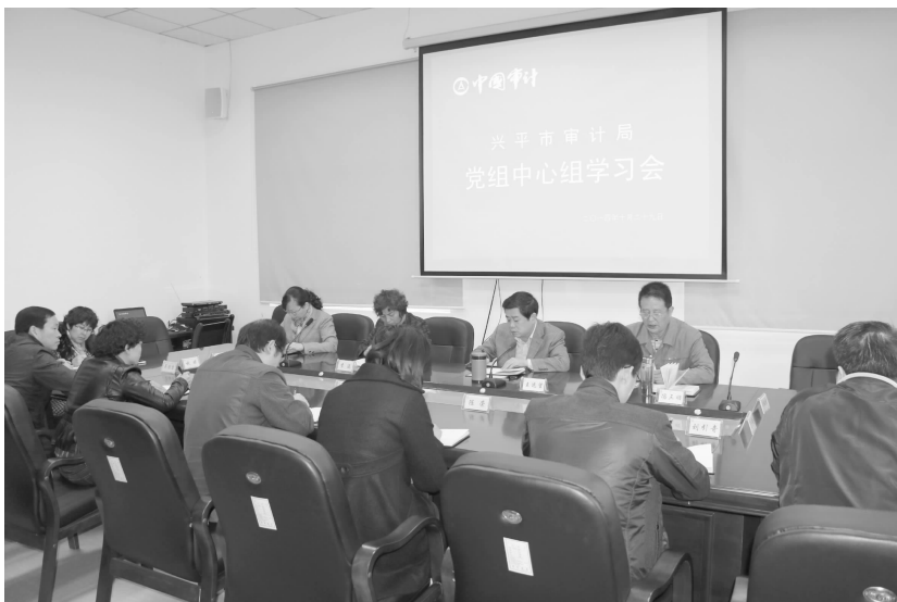
党组中心组学习会

审计。延伸审计了市人社局、住建局、农林局、教育局、水利局、民政局等 11 个预算执行单位及其所属的二级预算单位。对南位镇、南市镇等 8 个镇政府 2013 年财政决算进行审计。对市国土局、工商局、西吴街道办事处等 16 个行政事业单位财政、财务收支进行审计。共查出违纪违规金额 1180 万元。以财务管理等内控制度的建立健全和执行情况,各项收支活动真实性、合法性和有效性审计为重点,对年度审计项目计划未安排的检察院、法院等单位财务人员由局内审机构培训指导,明确自查的重点内容和要求,促进自查单位更加规范的执行财经法规,提高资金的使用效率。