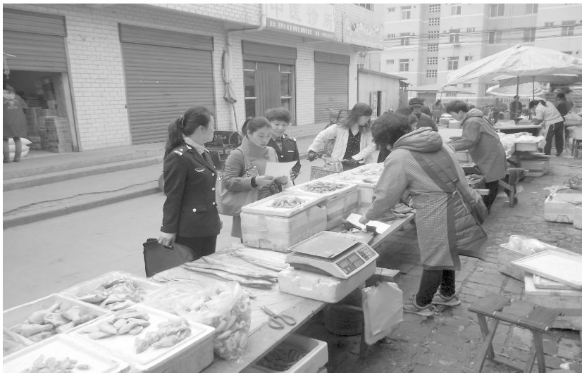
水生动物防疫检疫

【防汛抗旱】 ①投入抗旱人员3800人次,开动灌溉机井4100余眼,抽水站5处,灌溉农作物32.6万亩。②汛前,开展河道清障专项整治,清理渭河碍洪物47万立方米,拆除河道临时建筑11处。③开展防汛责任制落实、防汛预案修订、防汛物料筹备、险工处置和抢险救灾人员组建等汛前准备工作。储备袋类21万条、备防石2000方、救生衣2000件、救生圈1000个、土工布3吨、冲锋舟2艘、发电机3台、水泵10台。④完成山洪灾害非工程措施一期项目建设,实现全市重点区域实时监测。山洪灾害补充项目正式立项,投资55.69万元,主要用于一期项目建设中监测预警平台、群测群防体系的补充完善。