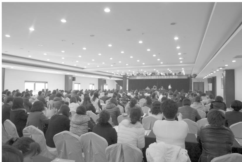
举办收费员培训会

【价格认证】 开展涉案物品价格鉴证52起、车损6起,鉴证标的金额118.9万元,办结率100%,无一例复核裁定。投资2万余元,完成