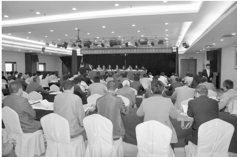
陕西省第五届防震减灾宣传活动周启动仪式及农村民居地震安全培训会

【招商引资】 ①把西安众和餐饮服务管理公司和现代生态农牧有限公司引入汤坊镇吴耳村,总投资 1559.64 万元。②10 月份,引进陕西禾益现代观光农业科技开发有限公司投资 1000 万元的大樱桃深加工项目。完成了全年的招商引资任务。