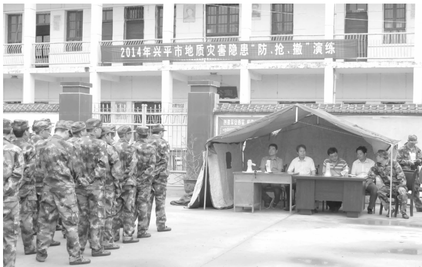
地质灾害隐患“防、抢、撤”演练

①全年征收陕西双汇食品公司、装备工业园“110KV 变电站”等项目用地 18 宗,面积 1430 亩。②完