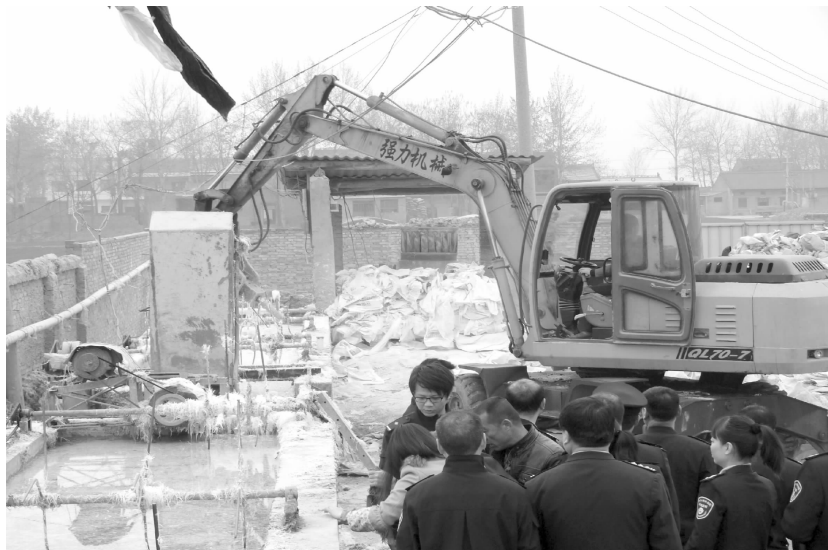
依法取缔废旧塑料颗粒加工点

【污染减排】 深化污染治理,实施总量控制,加大淘汰落后产能。投资 1.23 亿元建成兴平市污水处理