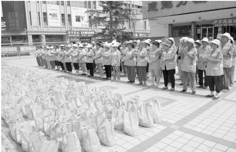
为环卫工人送清凉活动

【概况】 共青团兴平市委员会位于县门东街市委大院内。2014年,内设办公室、学校少先队部、工青部、组织宣传部,有干部7人。团市委把加强青少年理想信念教育作为根本任务,把做好服务青少年工作作为重要职责,把加强团干部作风建设作为关键环节,不断扩大团的工作覆盖面,提高团的吸引力和凝聚力。团市委在全省发挥队刊作用——深入开展“红领巾相约中国梦”主题教育活动中被团省委授予优秀奖,被共青团咸阳市评为共