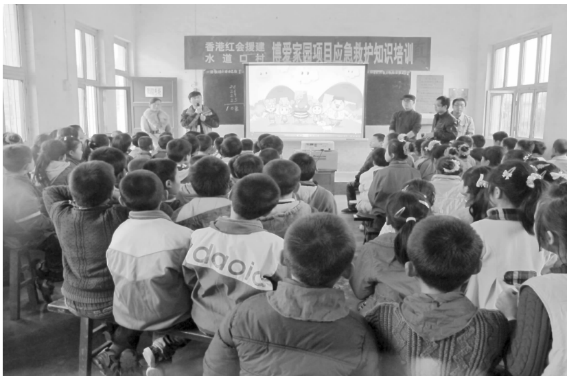
在学校开展应急救护培训活动

【宣传工作】 ①通过人道网、省红十字会网、咸阳市红十字会网、兴平市政府网、兴平电视台、咸阳日报等媒体、网站,宣传红十字精神、红十字知识及各类活动信息。全年累计宣传播放信息128余条,其中兴平电视台播放宣传信息8篇,咸阳电视台播放信息5篇,咸阳日报刊登3篇,省、市红会网站发布宣传信息38篇,在市政府网站发布宣传信息15篇,在人道网发布14篇,在兴平红会网站发布宣传信息45篇,联合兴平电视台录制《新闻话题》节目1期。②5月12日(防灾减灾日),在影剧院广场、兴化社区向群众宣传红十字会基本知识、红十字精神及心肺复苏、骨折、止血、包扎、搬运方法等自救互救知识,发放急救知识手册400余份,宣传人数800余人。③征订《中国红十字报》和《博爱杂志》各100份以上。④6月9日至16日,兴化社区