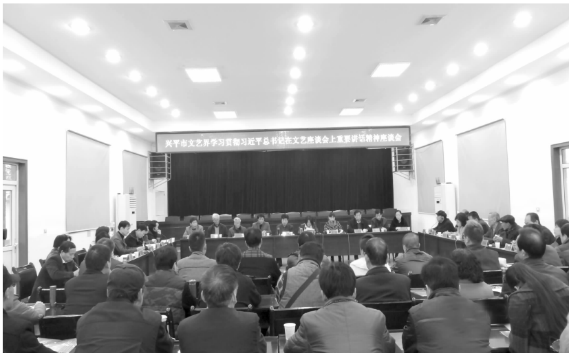
学习贯彻习近平总书记文艺座谈会上重要讲话精神座谈会

老年书画展,展出作品 130 余幅,并于 10 月、11 月在社区和学校进行巡展。