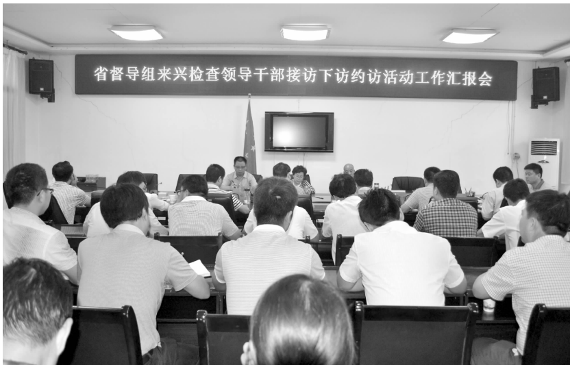
省督导组来兴检查领导干部接访下访约访活动工作汇报会