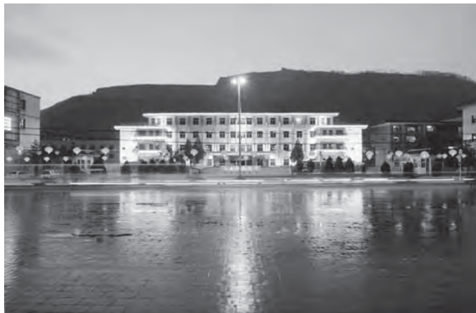
富县人民广场夜景