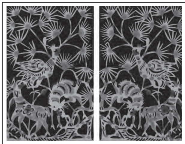
富县熏画—松鹤延年