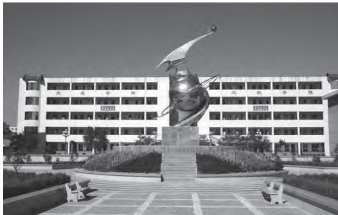
富县高级中学校园一角