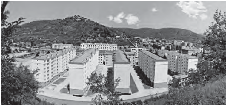
温馨优美的桥苑小区

各位代表，富县正处在奋力崛起、跨越发展的关键时期，困难和挑战考验着我们，责任和使命激励着我们。让我们在市委、市政府和县委的坚强领导下，全面贯彻科学发展观，以更加坚定的信心、更加昂扬的斗志、更加创新的精神、更加务实的作风，顽强拼搏，锐意进取，努力开创富县科学发展、和谐发展、跨越发展的新局面。