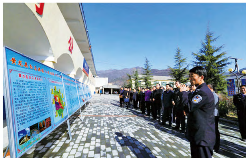
2015年12月3日，黄龙县人民调解工作现场会在白马滩镇召开。省司法厅、市司法局、县级各相关部门领导、各乡镇（社区）调委会负责人、司法所所长、行业调委会主任等50余人参加会议。