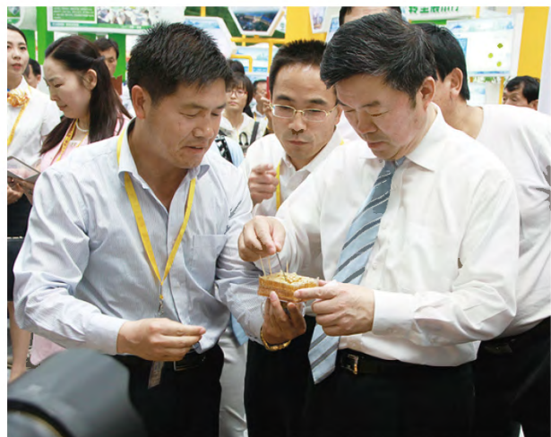
市委书记姚引良（右一）品尝蜂蜜