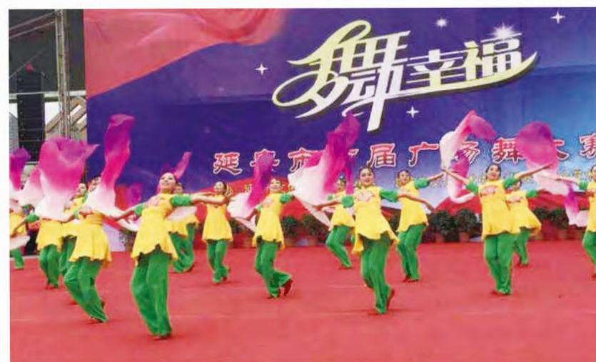
2015年4月8日，在延安市艺术中心文化广场举办延安市首届广场舞大赛。图为黄龙县文化馆青青之舞蹈队一队《廊韵风情》。