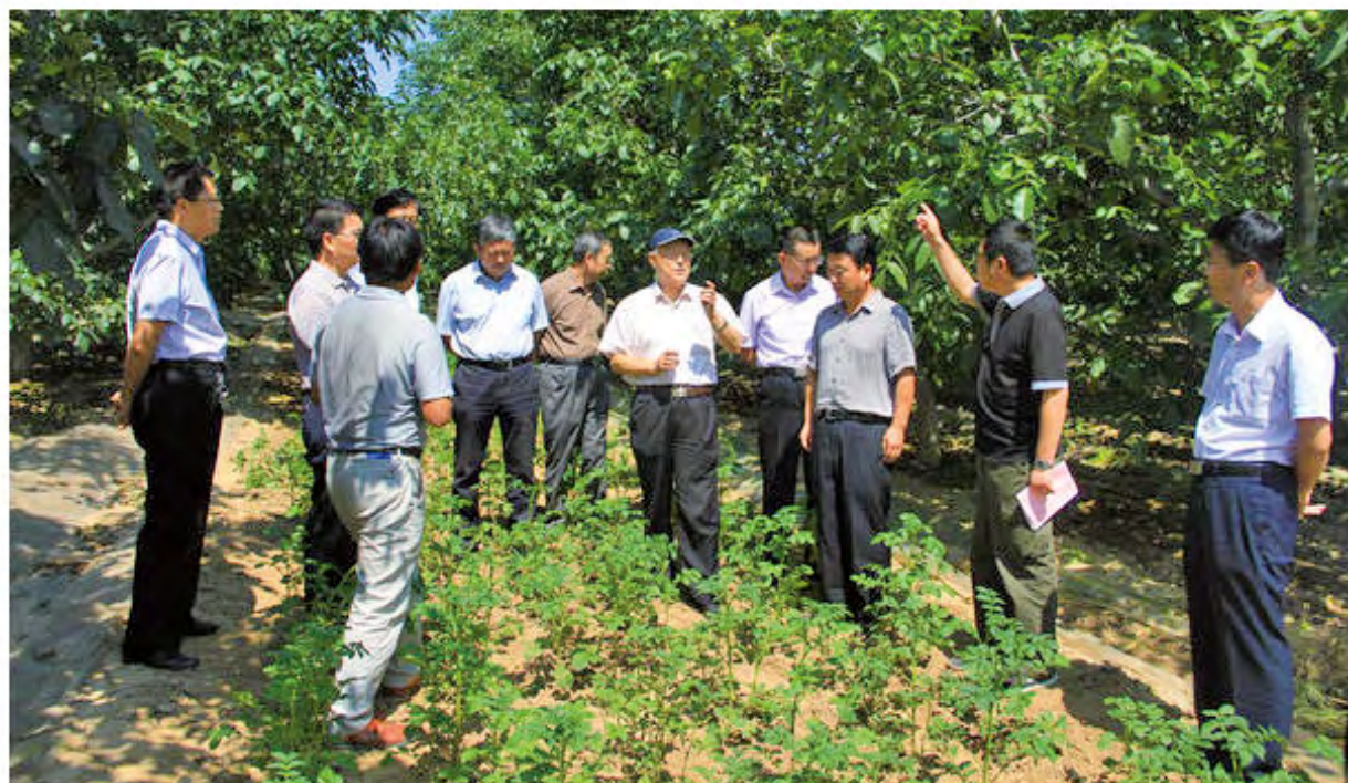
2016年7月7日上午，原陕西省人大常委会副主任陈再生（右五）在省林业厅副厅长拓平（右七）和黄龙县委常委、统战部部长中龙及县相关部门同志的陪同下，深入圪台乡南峪村七影山鸡养殖场、大刚繁育养殖点和白岩村中蜂养殖点进行工作调研。