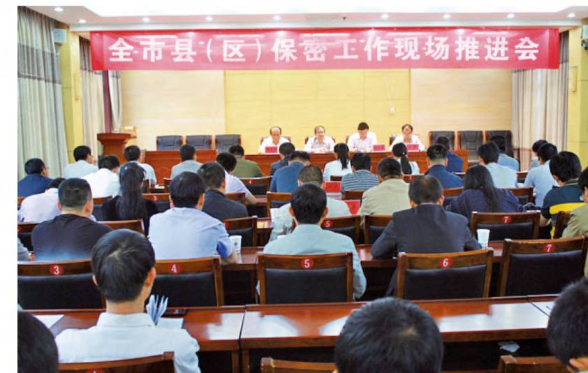
2015年5月28日，全市县(区)保密工作现场推进会在黄龙县隆重召开。市国家保密局局长李延洲、市国家保密局副局长曹道君以及全市13个县区国家保密局负责人参加会议。