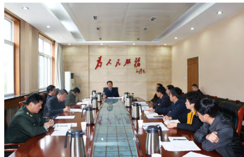
2015年11月4日上午，黄龙县委常委班子举行“三严三实”第三个专题第一次研讨交流。