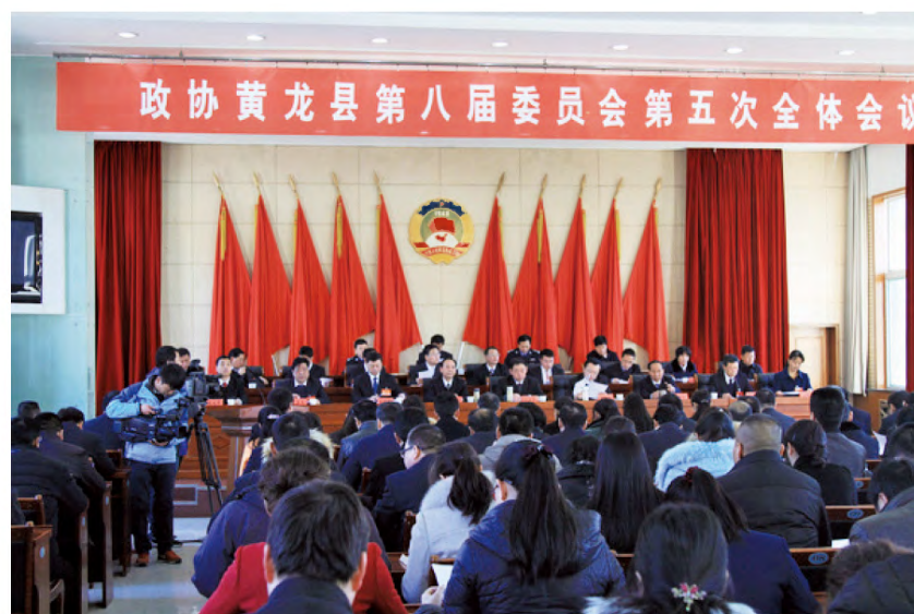
2015年2月16日上午9时，政协黄龙县第八届委员会第五次会议在县委五楼会议室开幕。