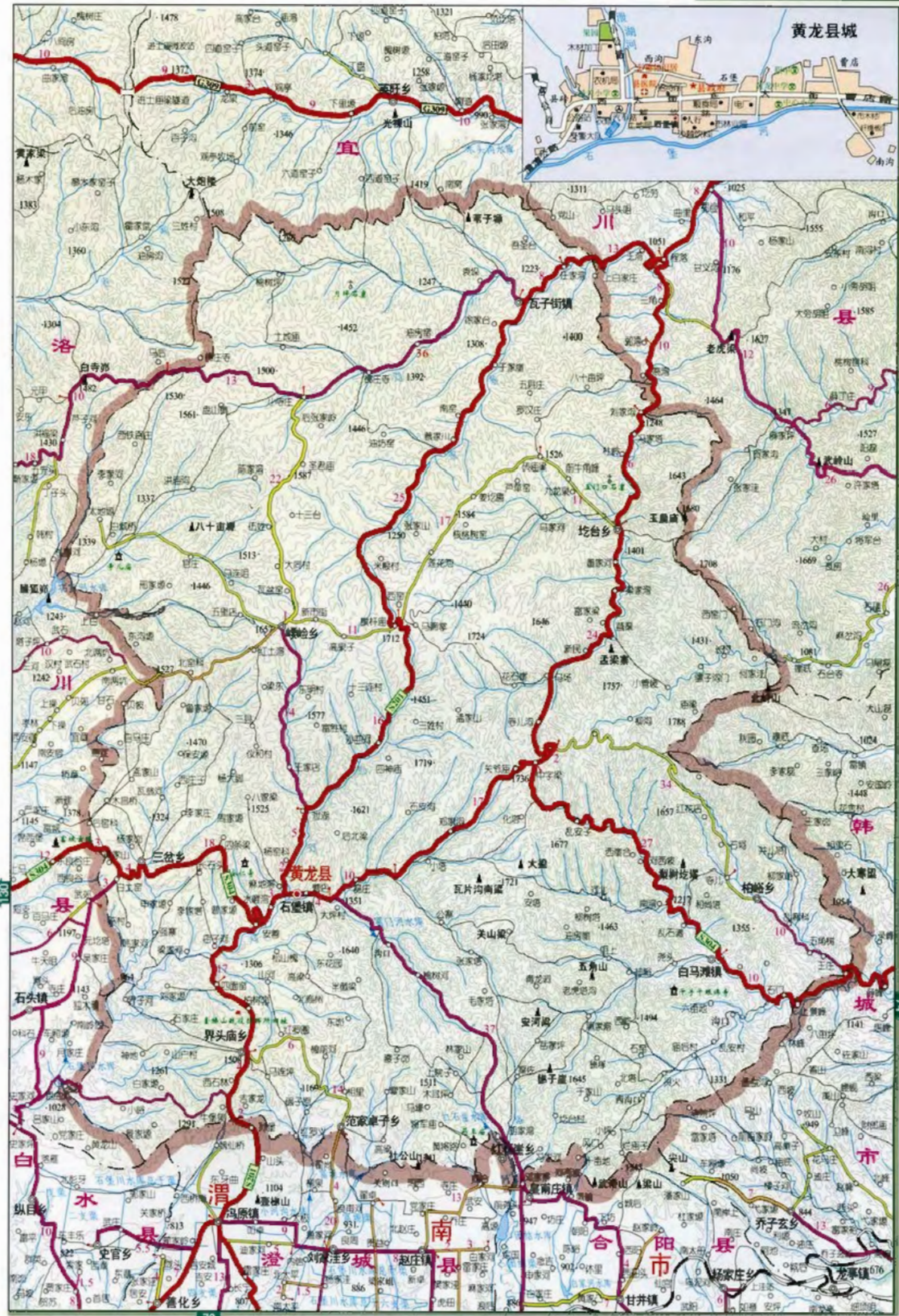
黄龙县行政区划图