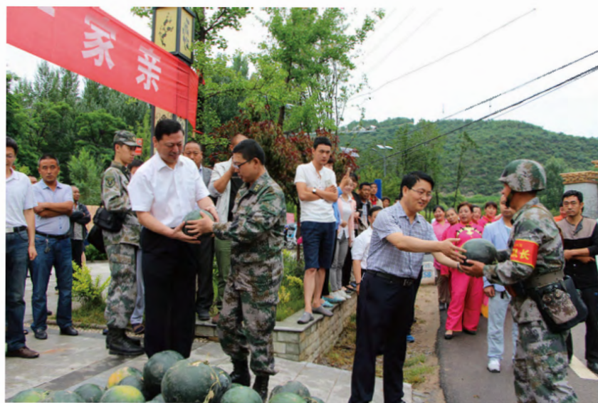
2015年7月15日，黄龙县四套班子领导、武装部领导、相关部门负责人、县城社区秧歌队及驻军复员的部分退役士兵，带着西瓜、矿泉水和鞭炮等，敲锣打鼓、扭秧歌、拉着横幅，从四面八方赶到县城双拥公园，像等待亲人一样深情慰问从这里经过的澄城县某驻军官兵。