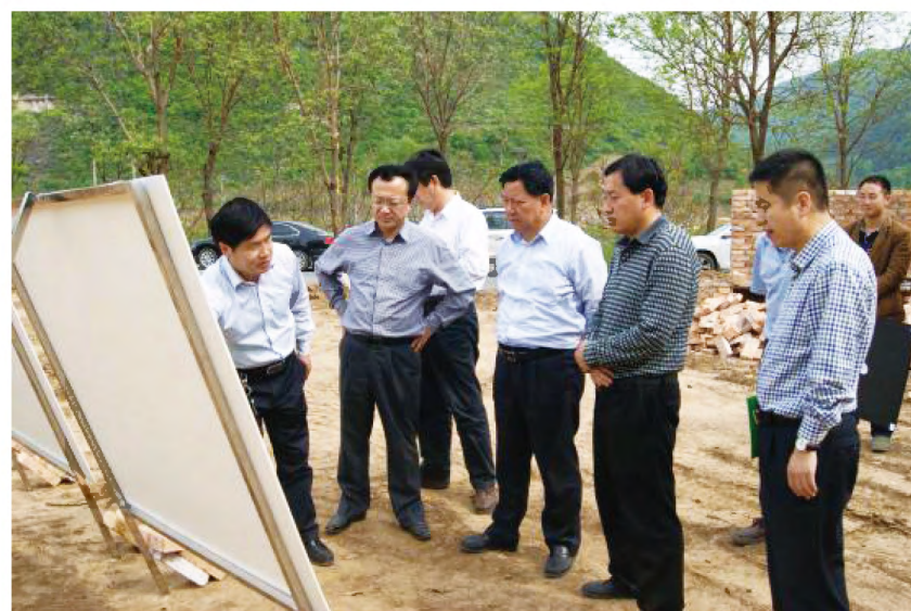
2015年5月5日，延安市委副书记杨霄（右三）调研黄龙县中峰工业园区，黄龙县县长任高飞、副县长高威陪同调研。