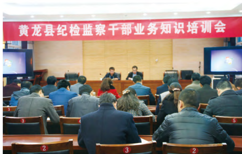
2015年11月19日至20日，黄龙县纪委举办全县纪检监察干部思想理论和业务知识培训会。