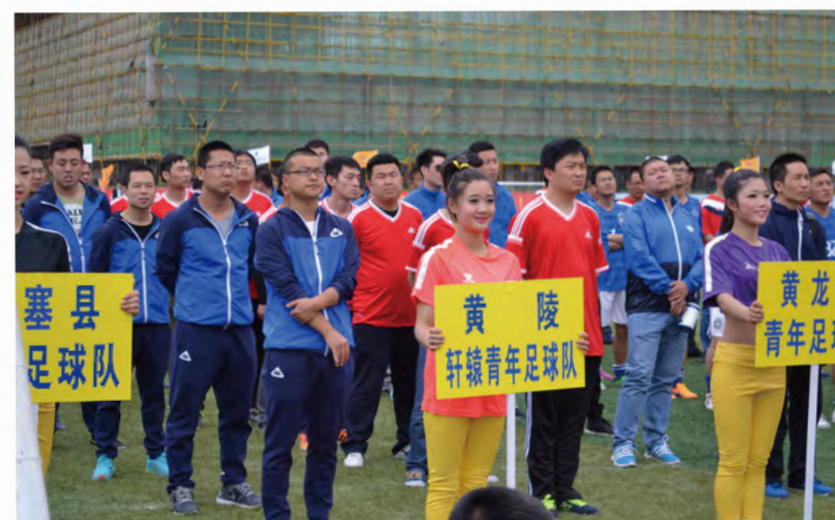
2015年4月24日，延安市首届“中果杯”青少年足球邀请赛在延安市职业技术学院拉开序幕，由团县委牵头组建的“黄龙县足球队”首次在市级比赛中登场亮相。