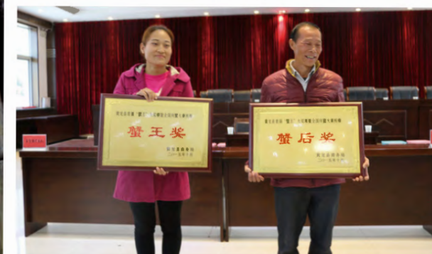
2015年10月29日上午，黄龙县首届“蟹王大赛暨全国河蟹大赛预赛”活动拉开序幕。