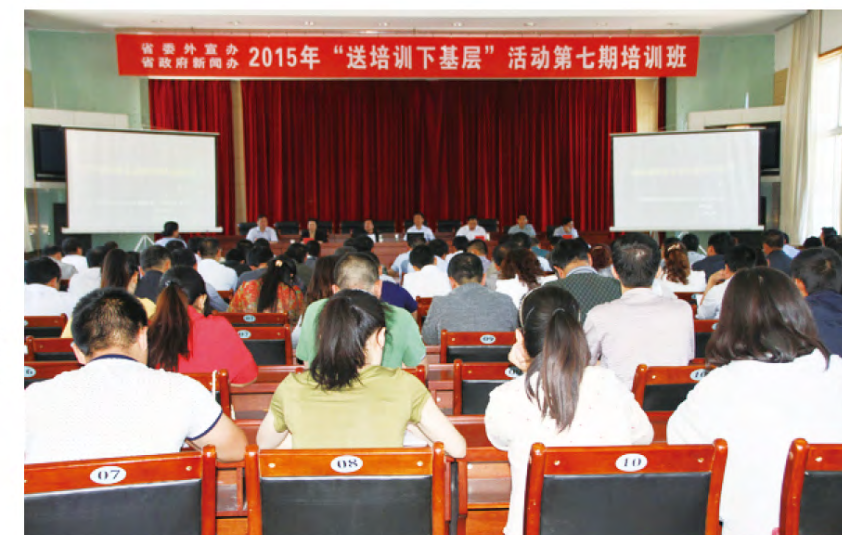
2015年6月11日，省委外宣办、省政府新闻办“送培训下基层”第七期活动走进黄龙，黄龙县全体在家县级领导、乡镇党委书记、乡镇长、县委、政府部门及管理机构、事业单位、群团组织负责人、部分大学生村干部等180余人参加培训。