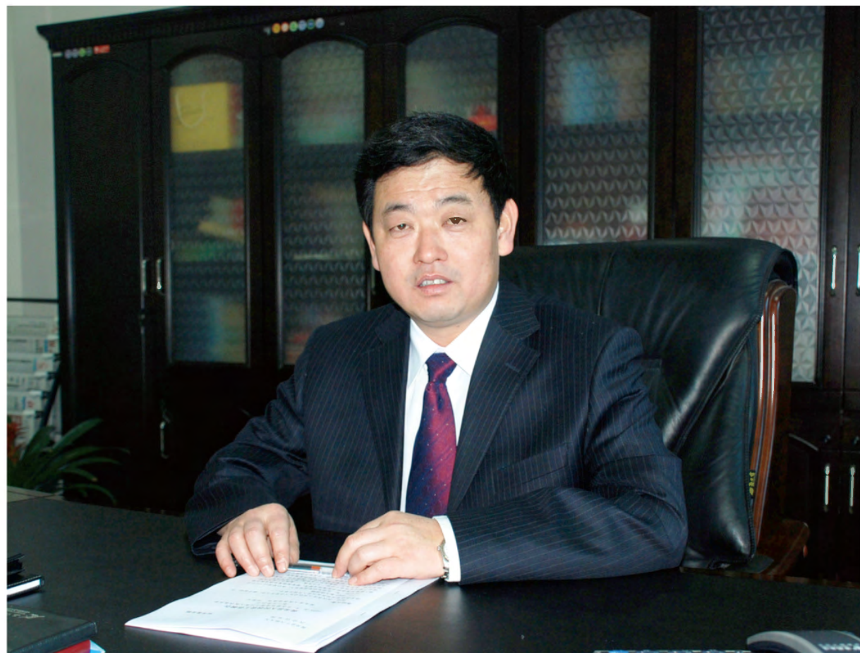
中共黄龙县委书记 刘亚宁