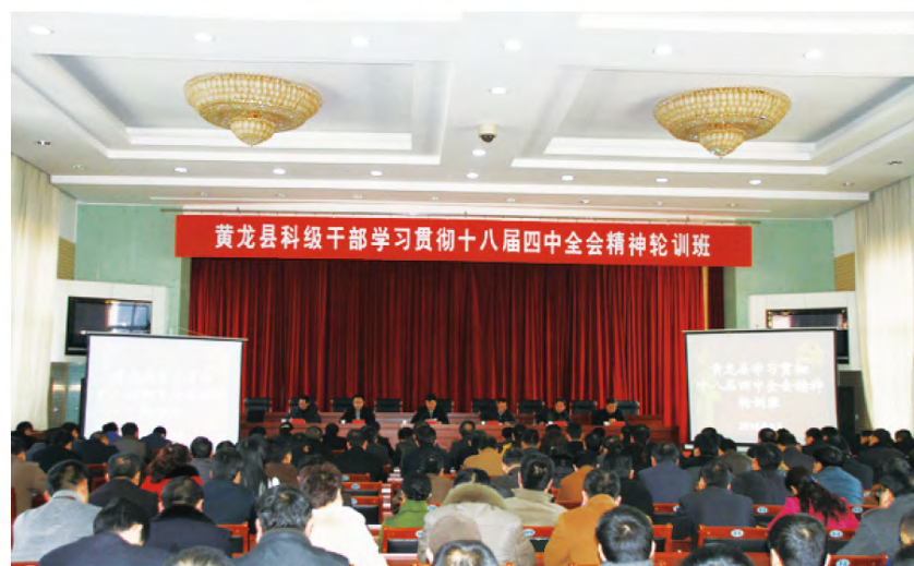
2015年2月26日至28日，黄龙县560余名科级干部参加学习贯彻党的十八届四中全会精神轮训。