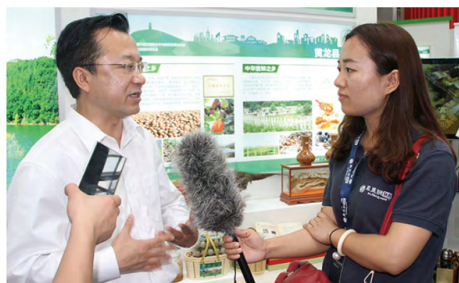
县长任高飞接受凤凰网记者采访