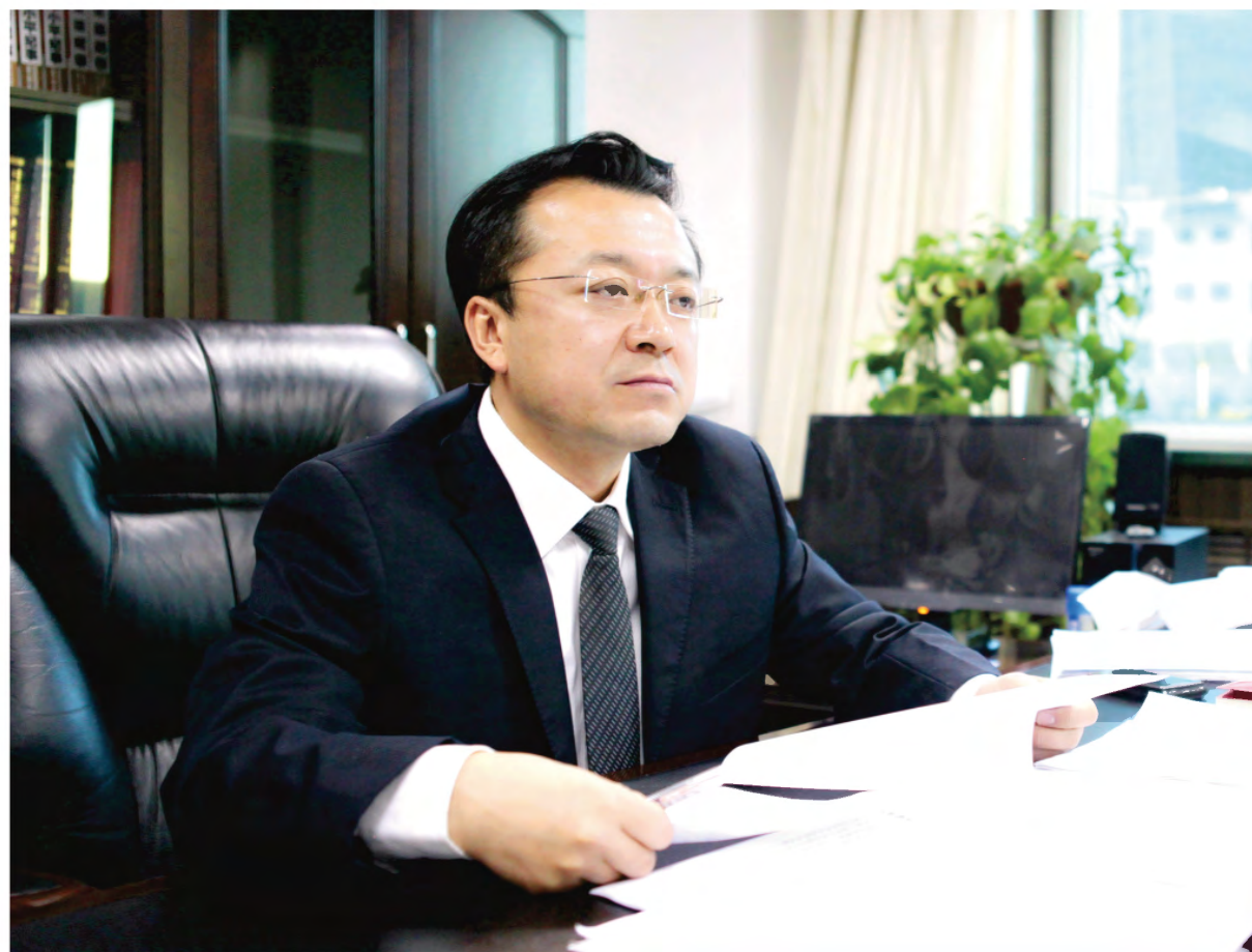
黄龙县人民政府县长 任高飞