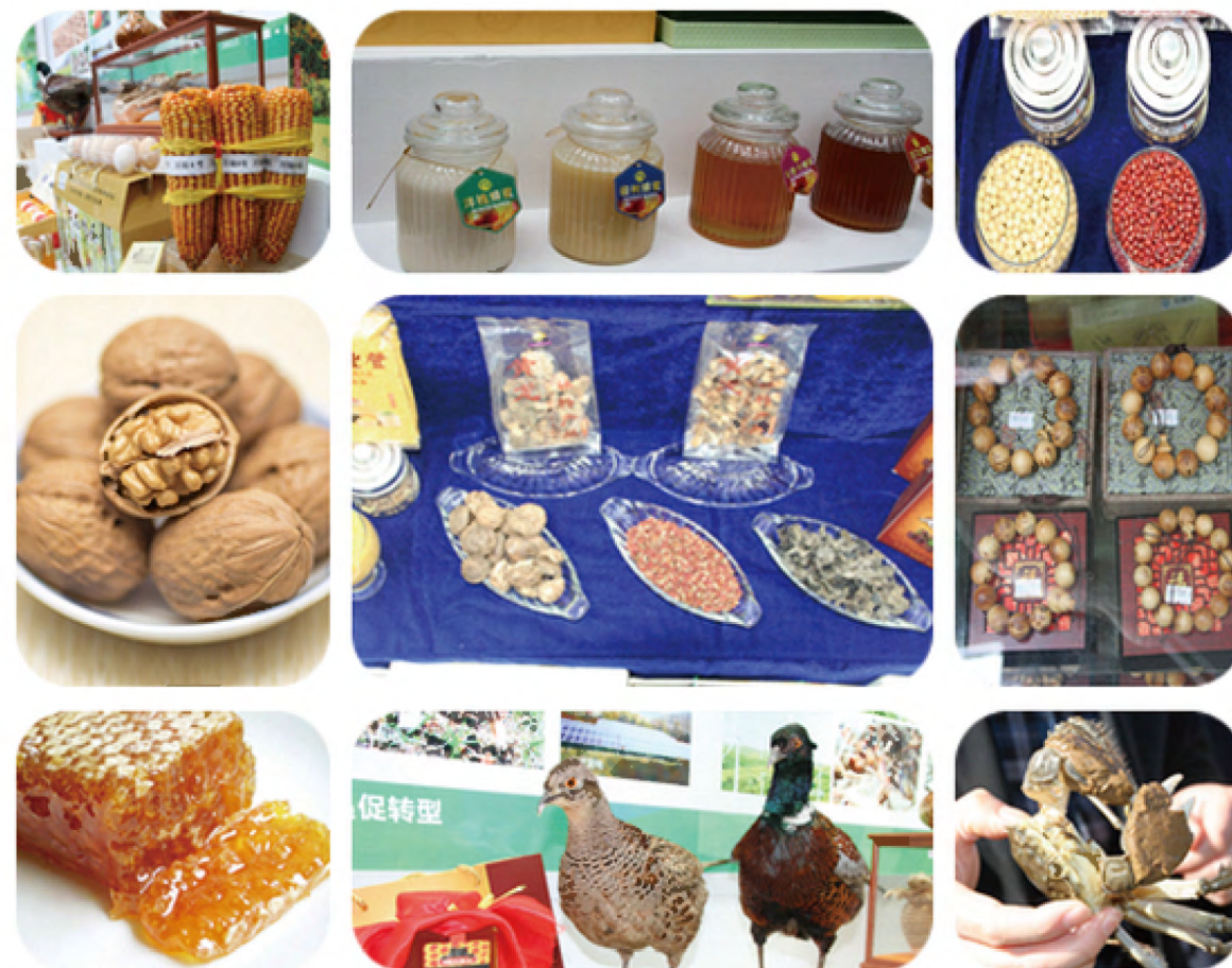
2015年5月21日至24日，黄龙代表团携带核桃类、中蜂蜜类、林特产品、玉米、苹果样品、山野鸡蛋、板栗样品、沙棘系列产品、黄龙肤施龙蟹展品参加第十九届西洽会暨丝博会。