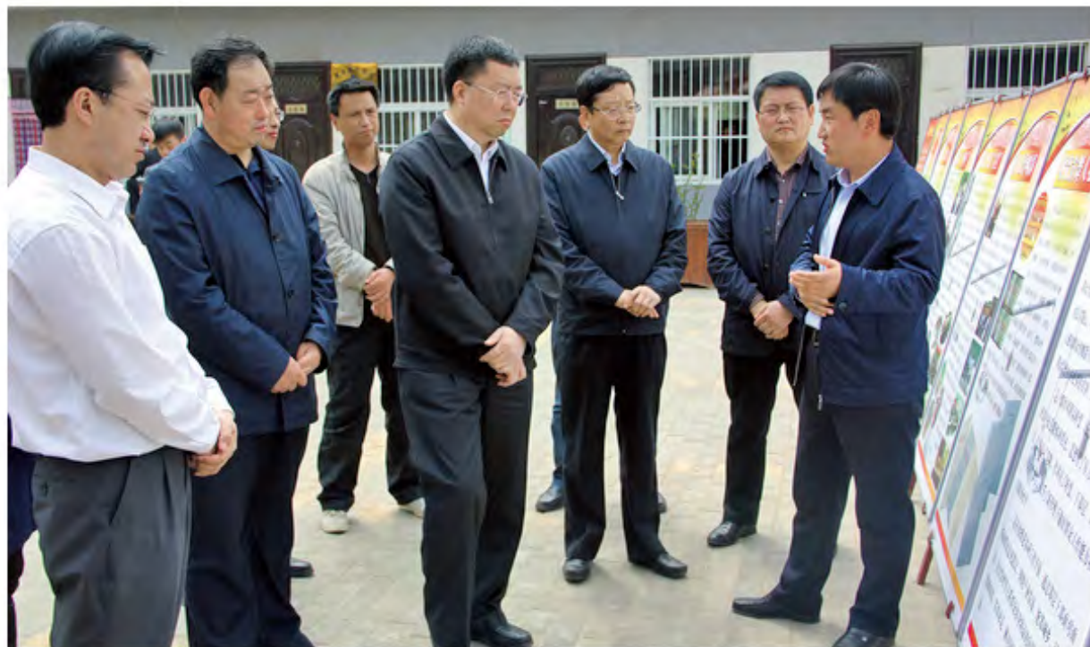
2015年4月17日上午，省委常委，组织部部长毛万春（前左三）到黄龙县三岔乡四条梁村曹家坝组、中心敬老院、水磨湾片区、石堡镇政府，就全县基层党建、产业发展等工作进行调研。