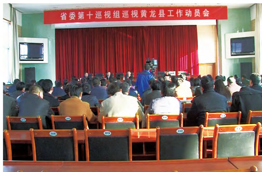
2015年12月7日，省委第十巡视组进驻黄龙县开展巡视。