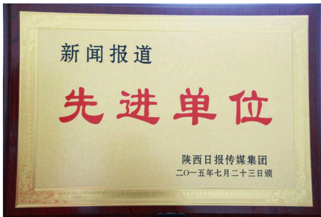
2015年7月23日，黄龙县委宣传部被陕西日报传媒集团表彰为2014年度新闻报道先进集体。