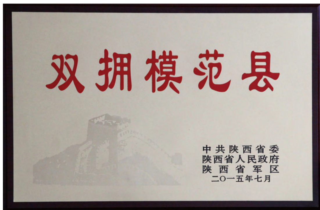
2015年7月31日，在陕西省纪念“八一”建军节暨双拥模范城（县区）表彰大会上，黄龙县被省委、省政府、省军区表彰为双拥模范县。