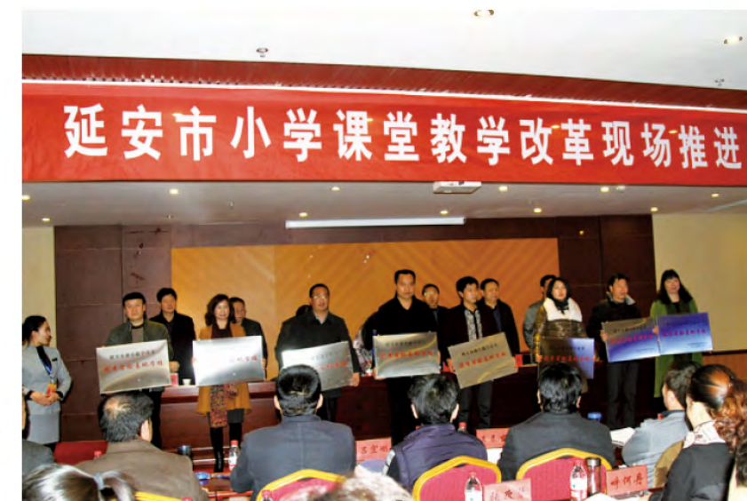
2015年12月11日，延安市小学课堂教学改革现场推进会在黄龙县举行。