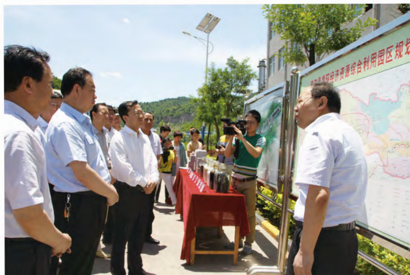
2015年7月1日，黄龙县全体在家县级领导和乡镇党委书记到黄陵县开展践行“三严三实”主题党日活动的。