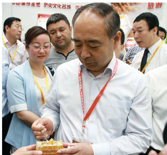
市长梁宏贤品尝蜂蜜