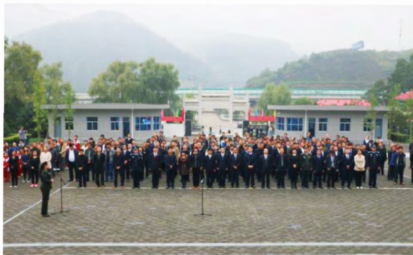
2015年9月30日，黄龙县组织全体县级领导、县级各工作部门负责人及社会各界代表共计300余人在陕西省爱国主义教育基地——瓦子街战役烈士陵园隆重举行烈士公祭活动。