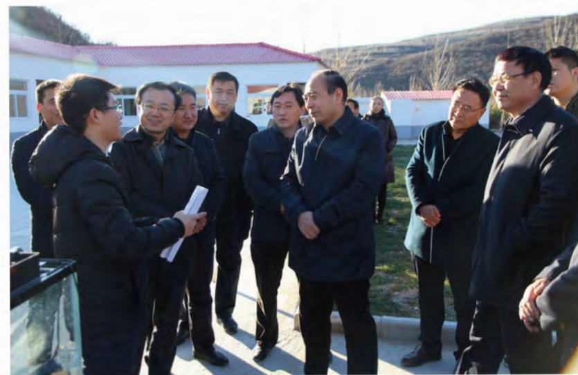
2015年12月3日，市委副书记、市长梁宏贤（右三）带领市政府办、财政局、扶贫局、林业局等部门负责同志深入黄龙县调研精准扶贫工作，并向基层干部群众宣讲十八届五中全会精神。