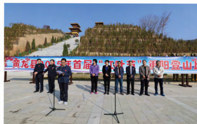
2015年10月21日，黄龙县首届“红叶节”登山比赛在无量山景区服务中心举行。来自全县各乡镇、县级各党委在职干部职工和登山爱好者200人参赛。