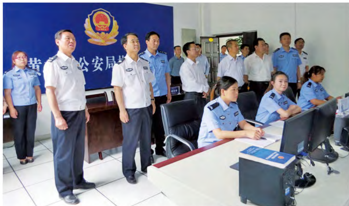
2015年5月29日，副省长、省公安厅厅长杜航伟（前左二）一行深入黄龙县，就基层公安改革工作进行调研。