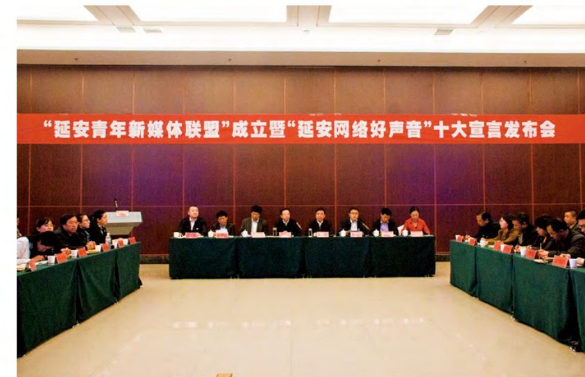
2015年10月17日下午，在市委网信办和团市委联合召开的“延安青年新媒体联盟”成立暨“延安网络好声音”十大宣言发布会上，“黄龙宣传”微博微信作为全市有影响力的新媒体应邀参加。