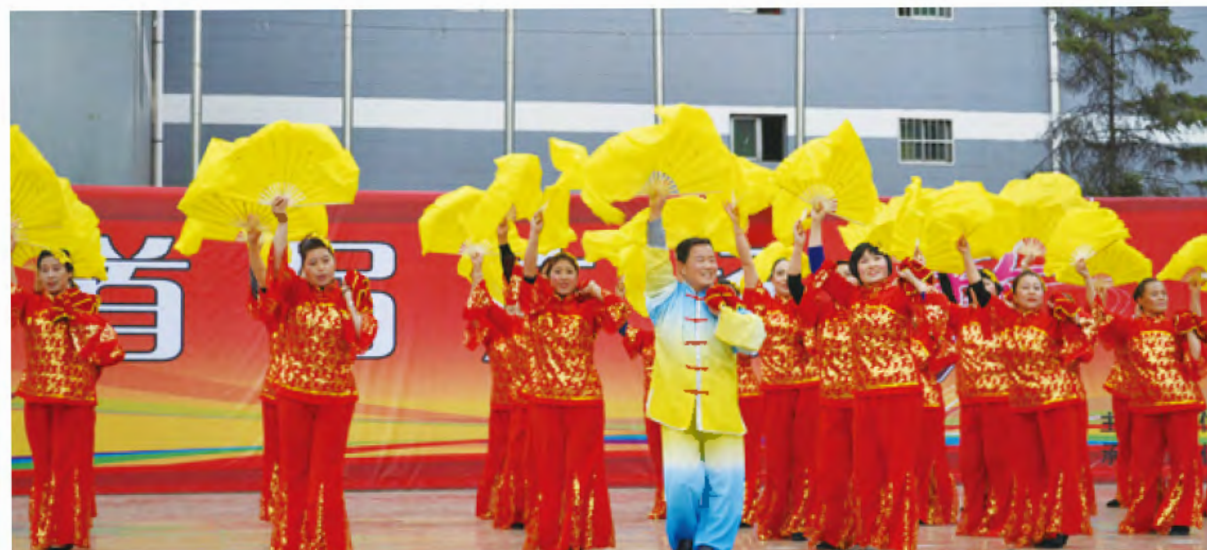
2015年3月31日上午，黄龙县首届广场舞大赛在县人民广场进行。