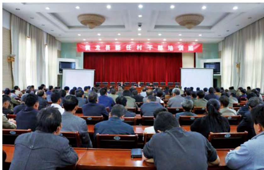
2015年9月29日，由县委组织部牵头，县委党校、县监察局、民政局和财政局联合举办的新任村干部培训班开始授课。