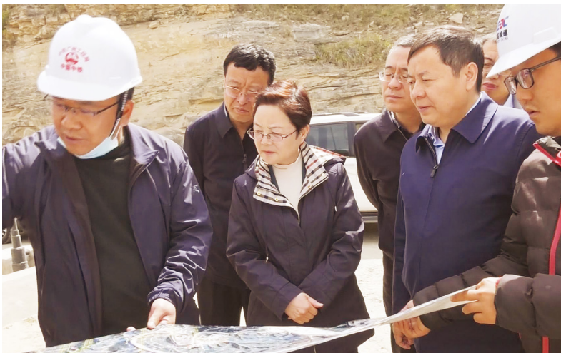
2020年4月22日，市委常委、常务副市长孙矿玲（左三）督导调研延长县经济运行、脱贫攻坚、安全生产等工作