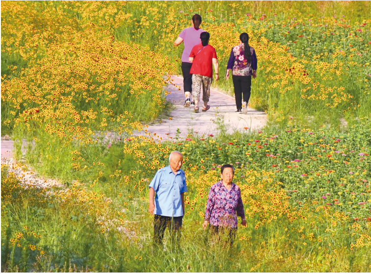
徜徉花海健身忙 (王德荣 摄)