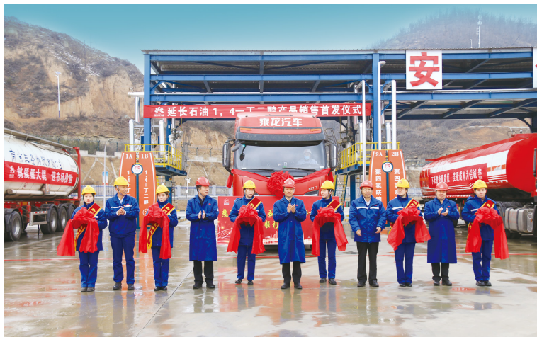
延长石油 1,4-丁二醇产品销售首发仪式