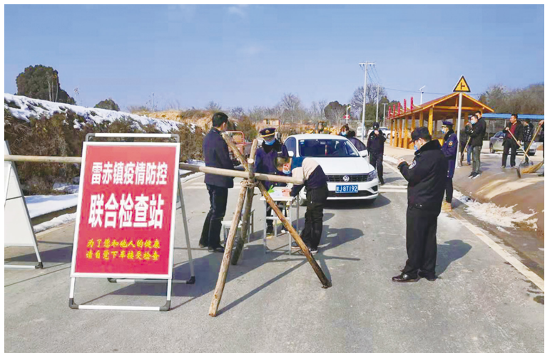
雷赤镇疫情防控联 合检查站