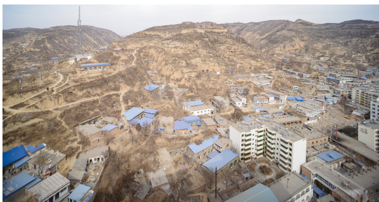
吴家山棚户区改造 前环境面貌