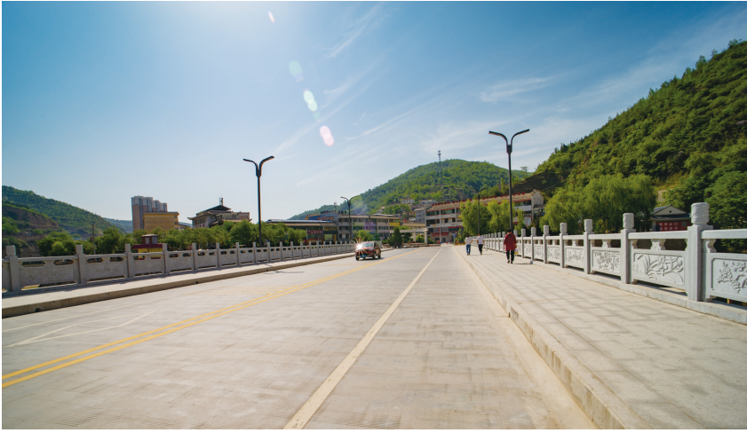
拓宽改造后的雷家滩大桥