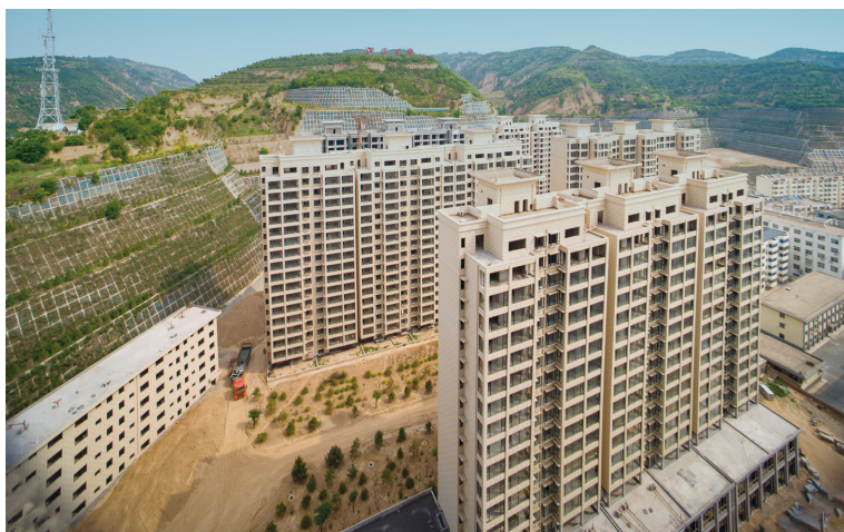
吴家山棚户区改造 后环境面貌