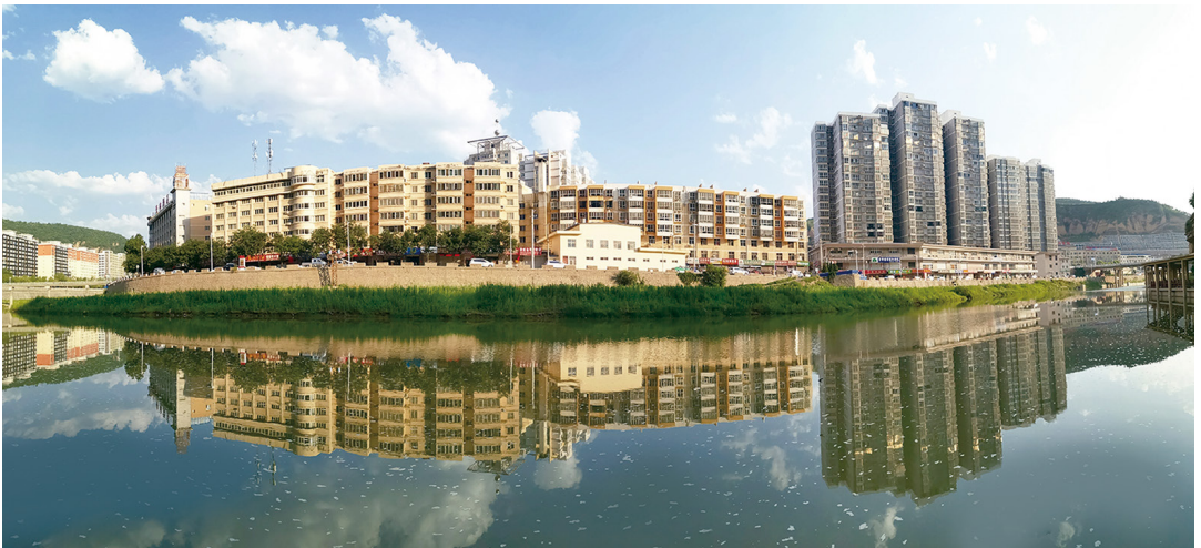
一湾碧水绕县城