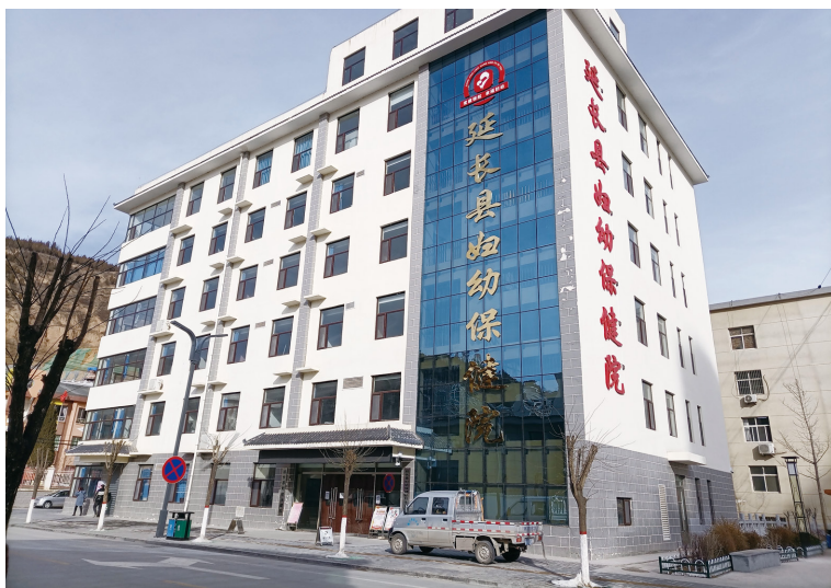
新建成的县妇幼保健院 门诊住院楼