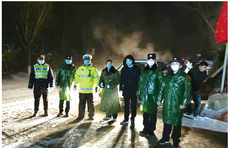
风雪中的坚守