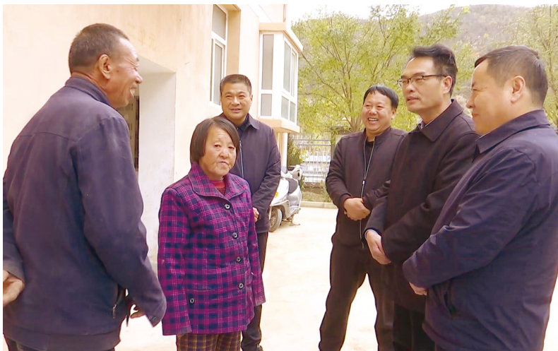
2020年10月27日，省林业局党组书记、局长党双忍（右二）来延长县帮扶点开展扶贫慰问及调研工作