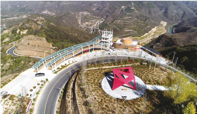
延长县沿黄公路老石观光点