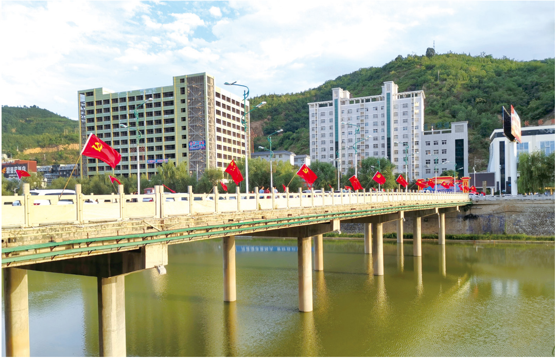
党旗、国旗飘扬延河上