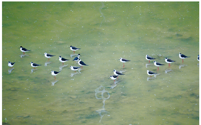
延河上的新客