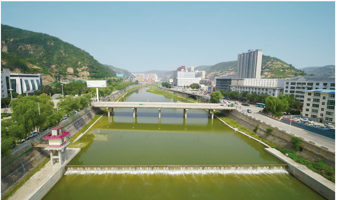
鸟瞰延河上的人工蓄水坝