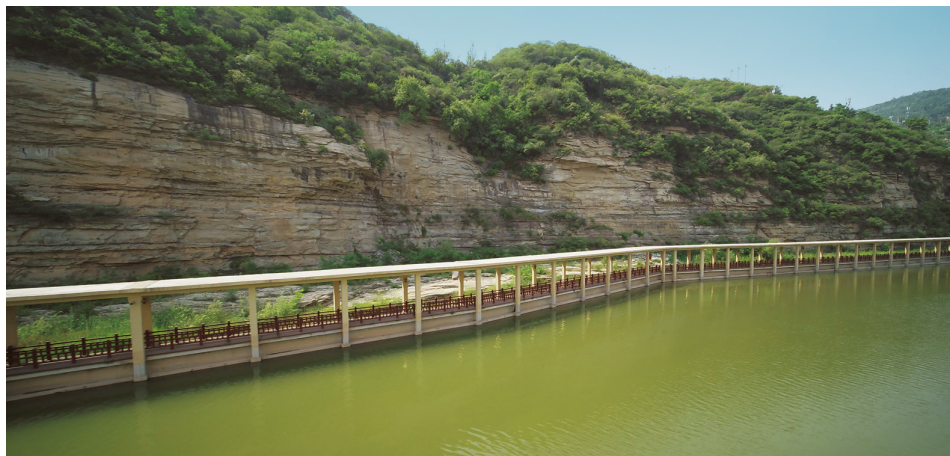
延河边的健身廊道