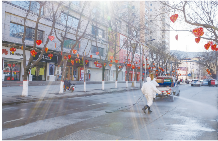
县城街区消杀