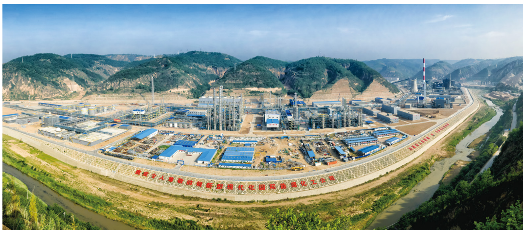
油田气化工科技公司全景