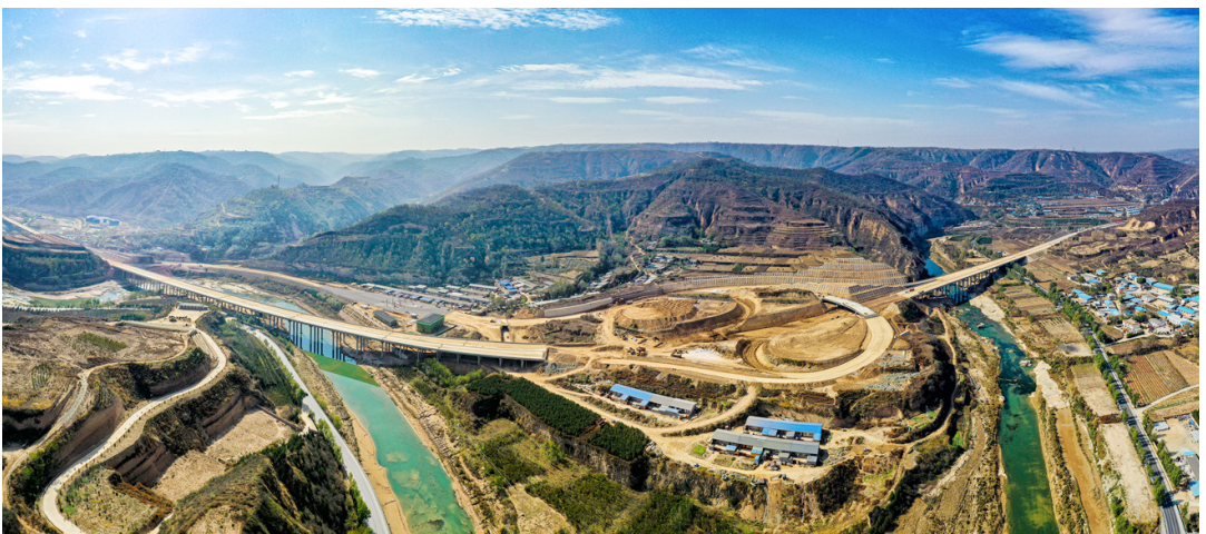
建设中的延(长)黄(龙)高速公路