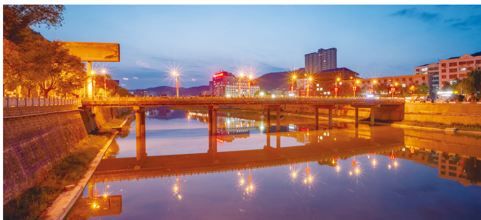
华灯初上景色美