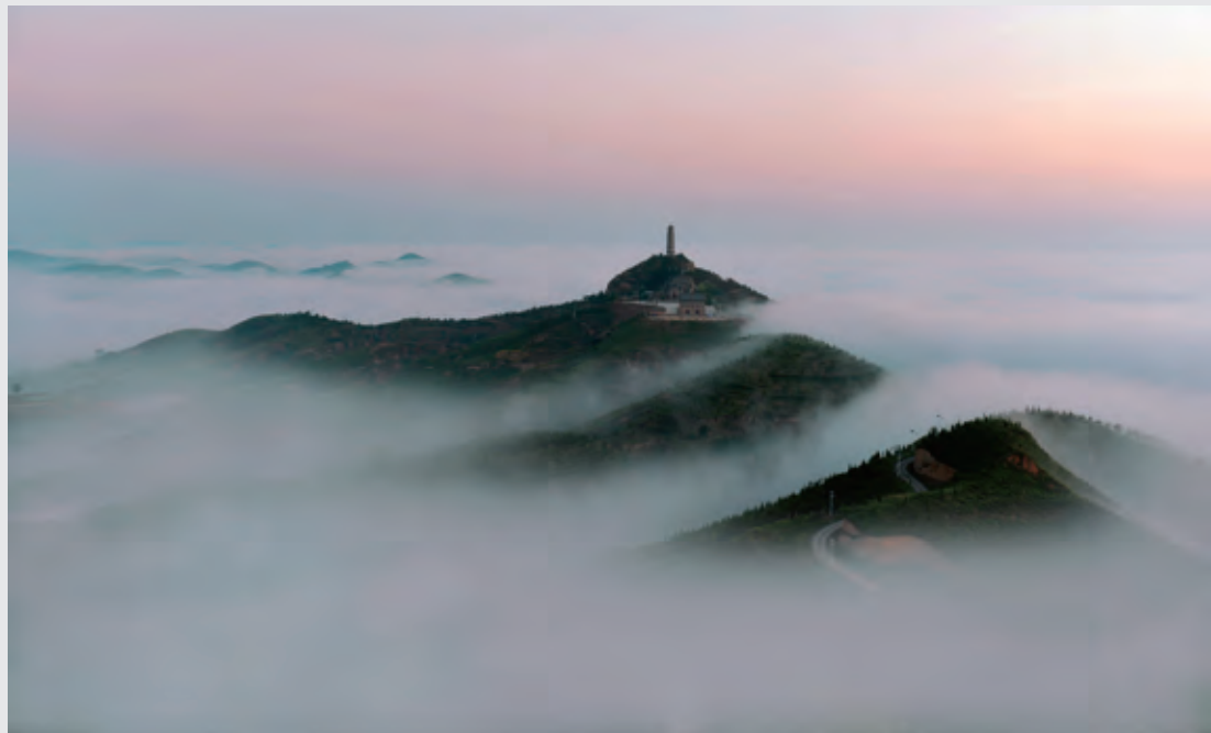
西峰胜境