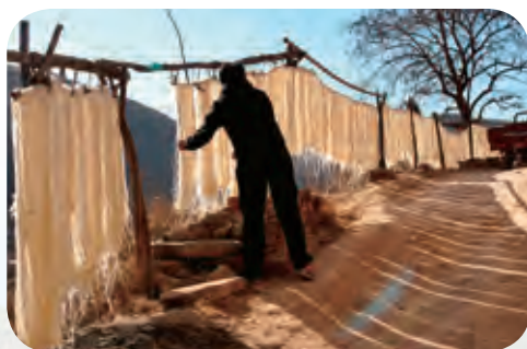
手工粉条加工产业