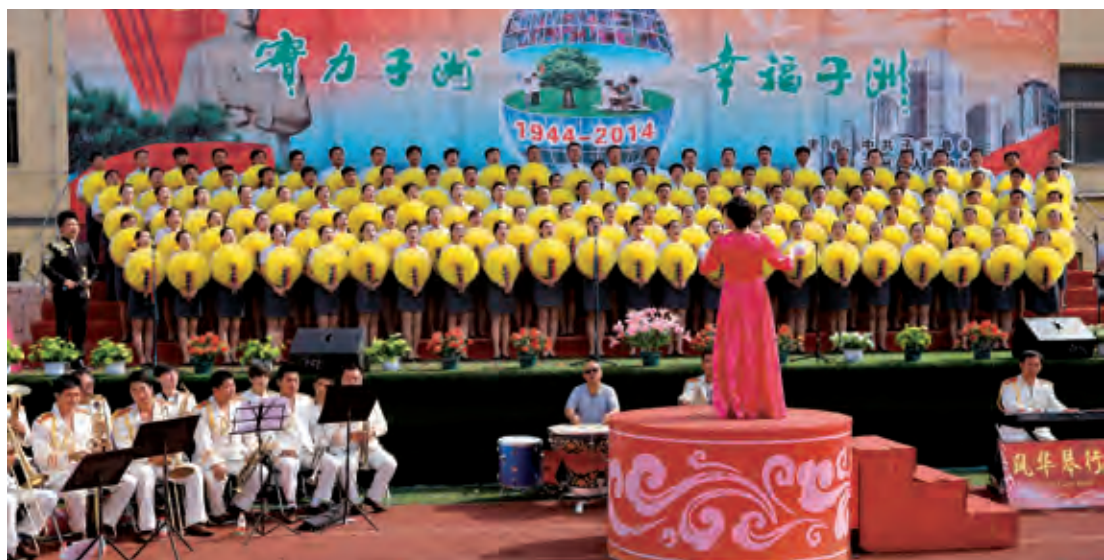
参加子洲县庆七·一暨建县七十周年歌咏比赛