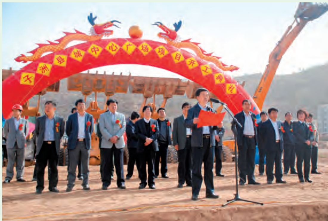
4月28日，县中心广场动工兴建