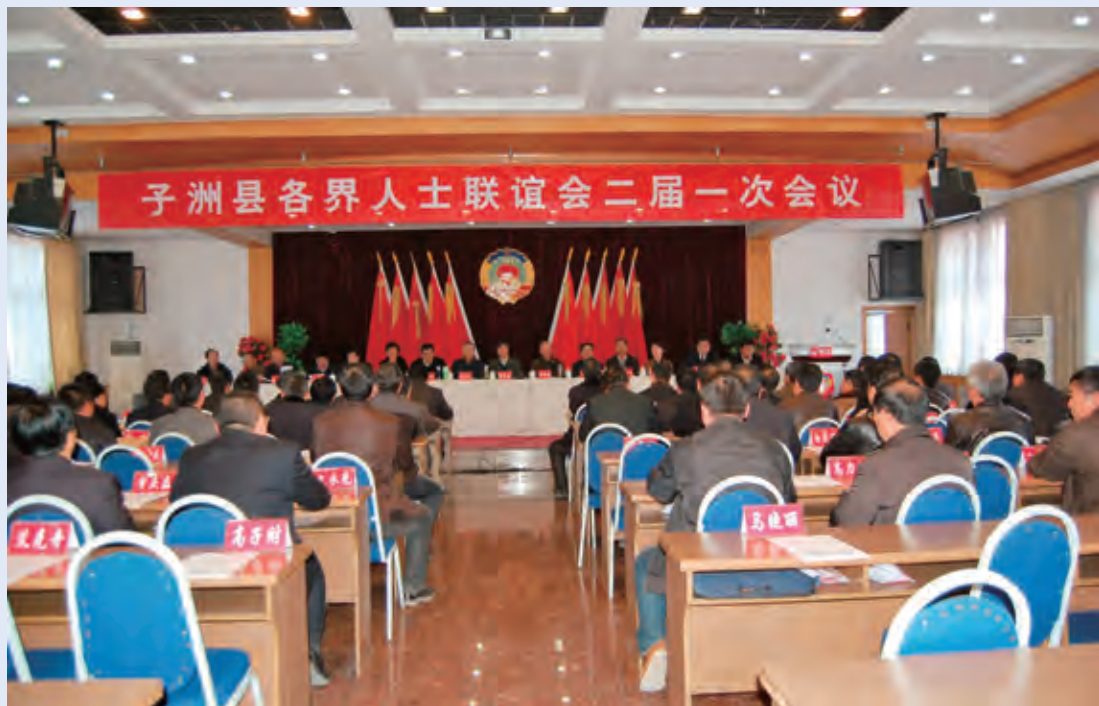
2月25日，子洲县各界人士联谊会召开二届一次会议