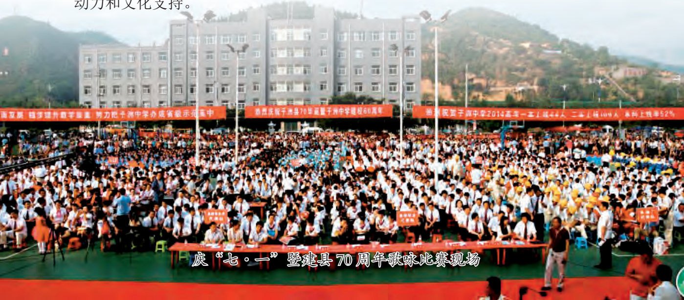
庆“七·一”暨建县 70 周年歌咏比赛现场