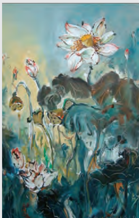
怒放的花（油画） 吕正宝