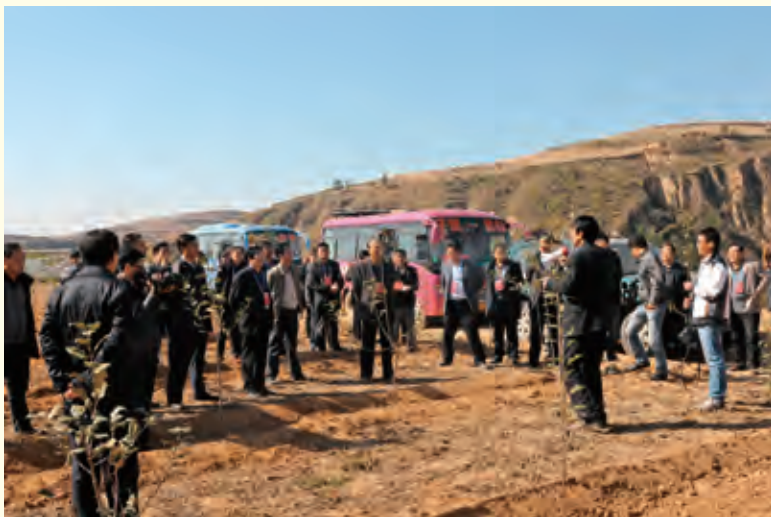
10月24日，县 政协委员视察全县山 地苹果发展情况