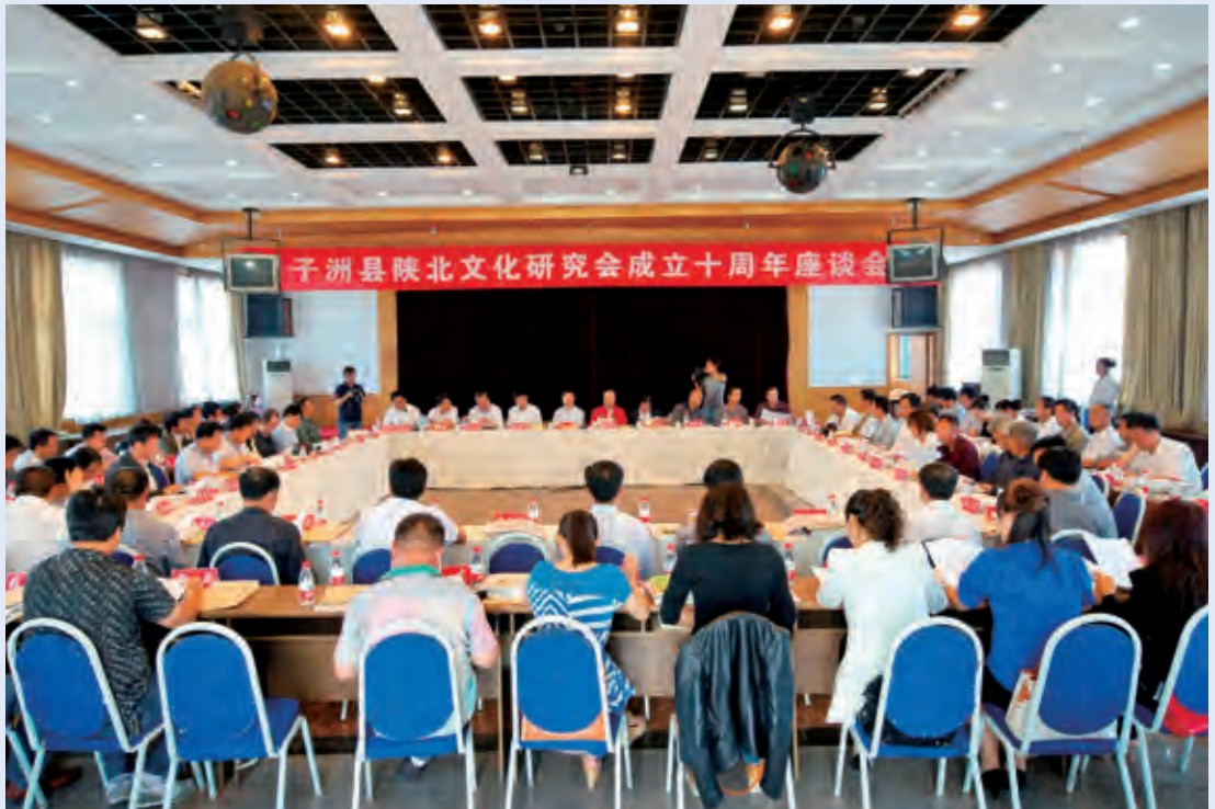
5月23日，召开子洲县陕北文化研究会成立十周年座谈会