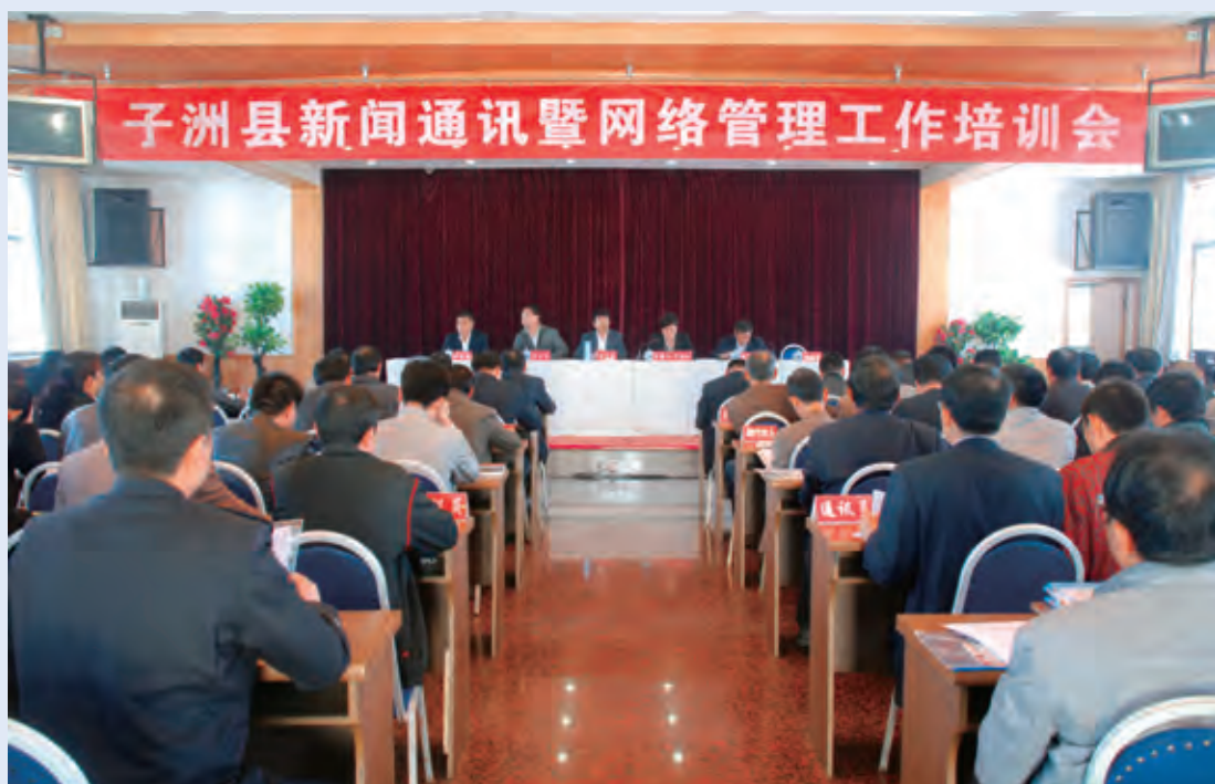
4月24日，县委宣传部召开新闻通讯工作会议