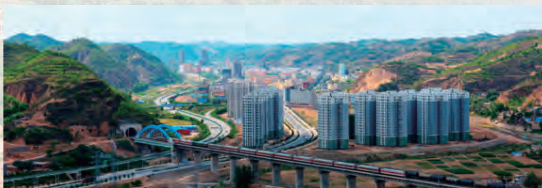
移民搬迁县城安置点颐和小区