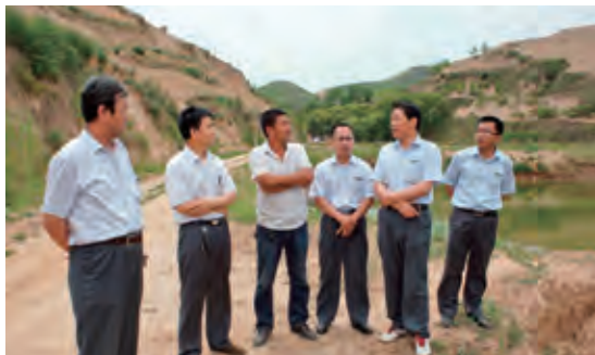
领导深入基层调研

2013 年以来，坚持以人为本，加强内部管理，各项工作全面推进。参与组织了两届子洲县“平安信合杯”运动会；在全县 2012、2013、2014 年政风行风民主评议活动中，连续三年获得第一名。荣获 2014 年度榆林市农村商业银行企业文化建设先进单位，2014 年度榆林市农村商业银行金融机构先进单位。