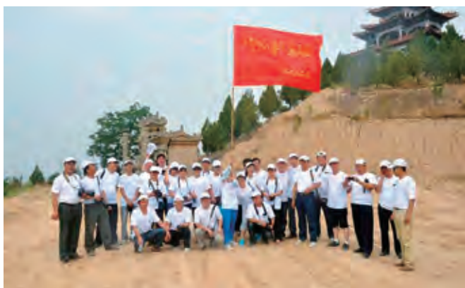
“子洲八景”采风团在路普山合影