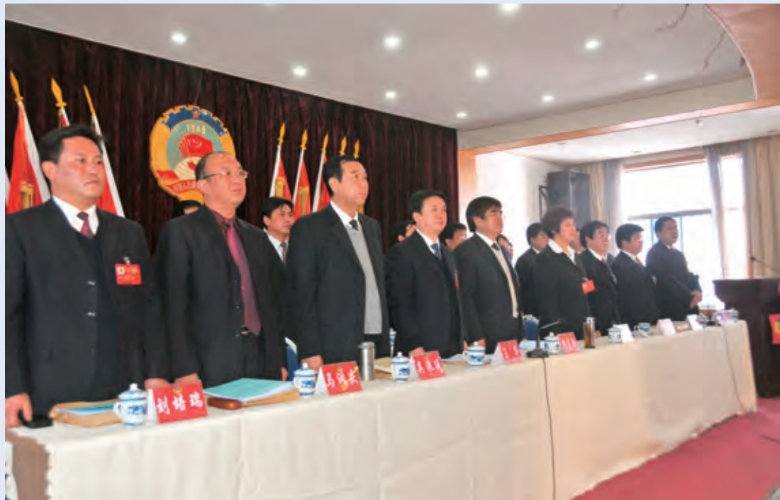
2月26日，政协子洲县八届二次会议在庄严的国歌声中开幕