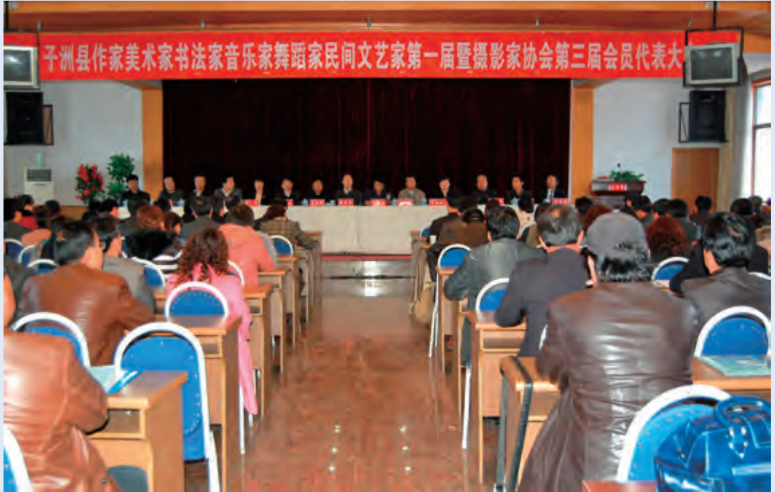
3月11日，县文联召开作家等六协会成立大会暨摄协三届一次会议