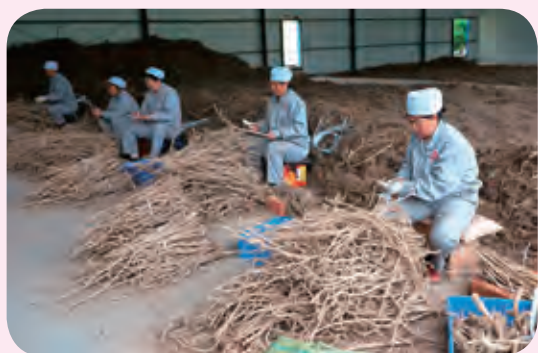
支持“三农”及小微企业发展