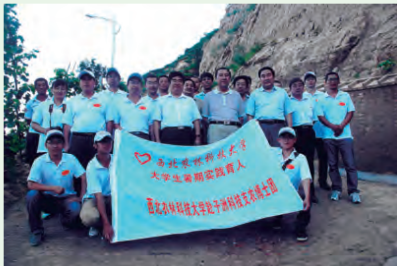
8月1日，西北农林科技大学博士团来子洲县考察调研