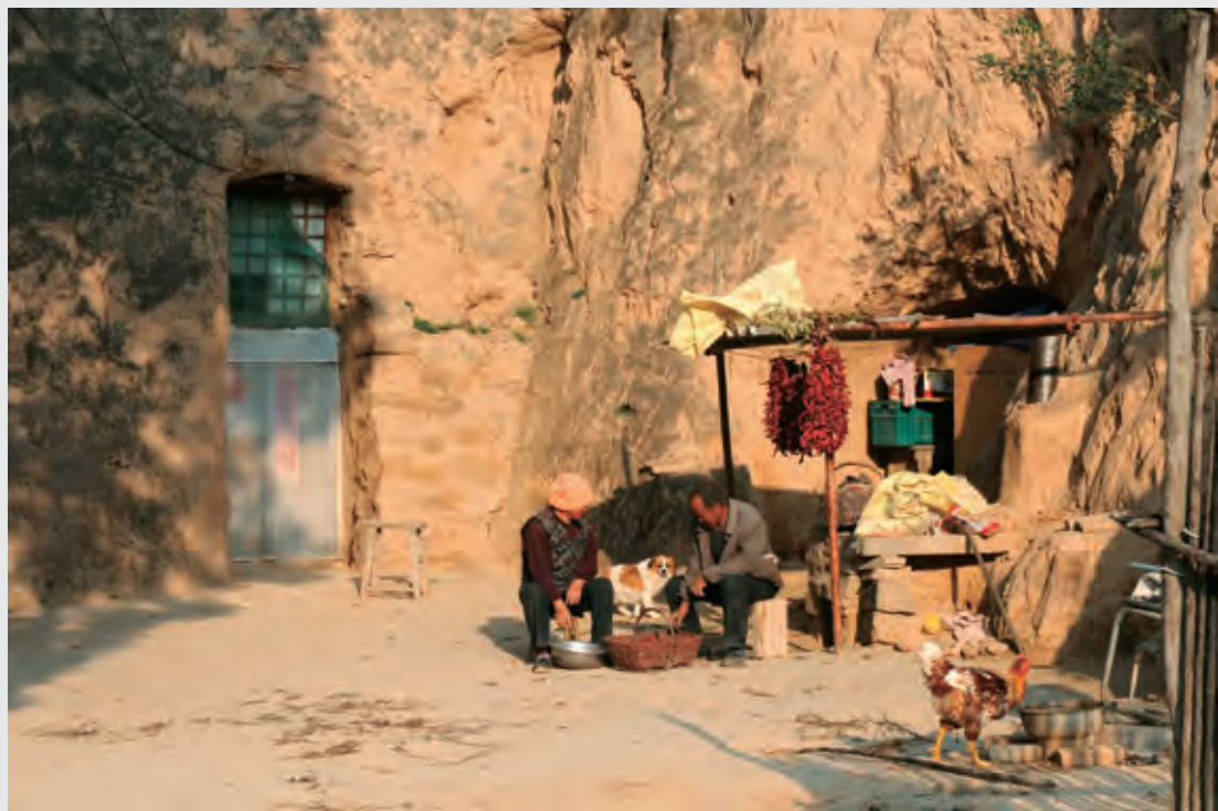
乡村人家