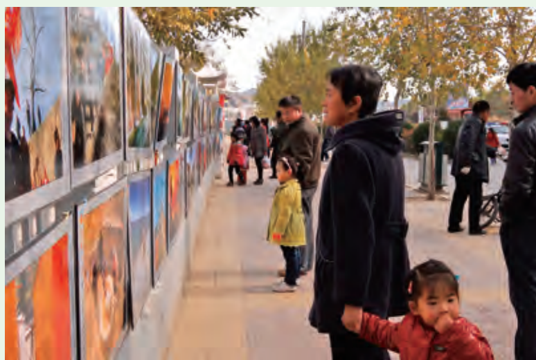
11月10日，人口和计划生育局与摄影家协会在体育场共同举办“幸福家庭·和谐计生”摄影作品展