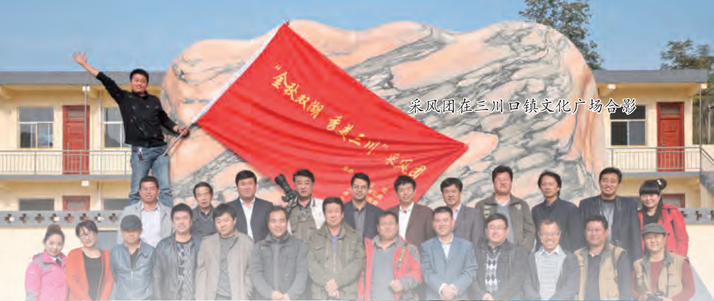
采风团在三川口镇文化广场合影