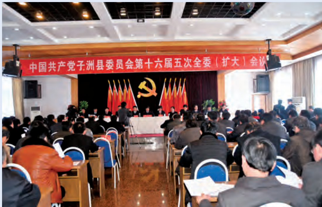
1月21日，中共子洲县委员会第十六届五次全委（扩大）会议隆重开幕