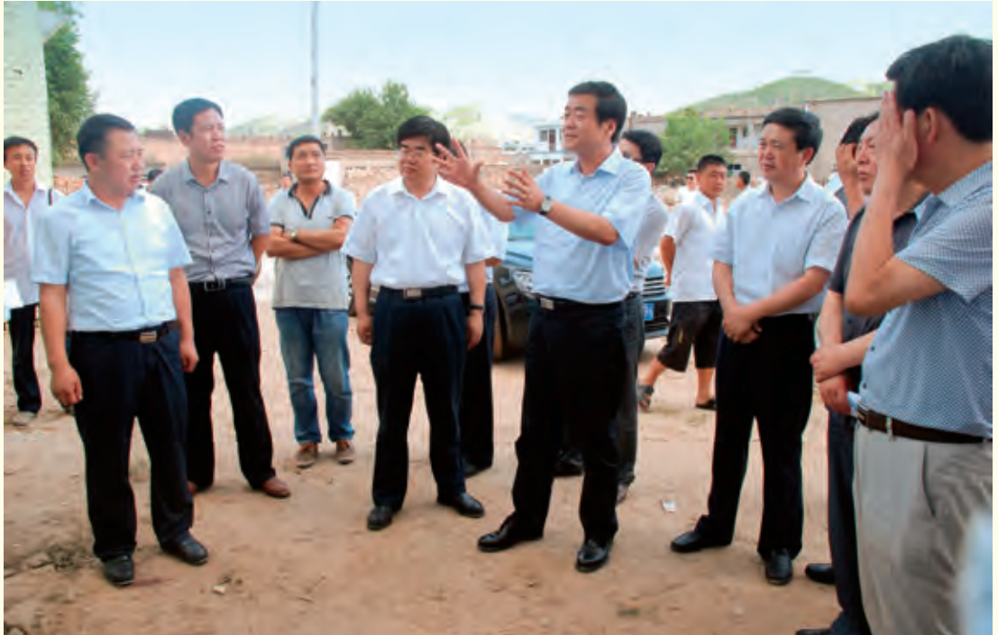
6月26日，常务副市长高中印来子洲县调研经济社会发展情况