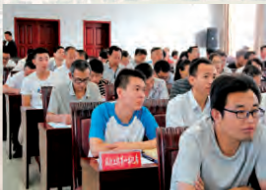
到村党支部挂职第一书记培训