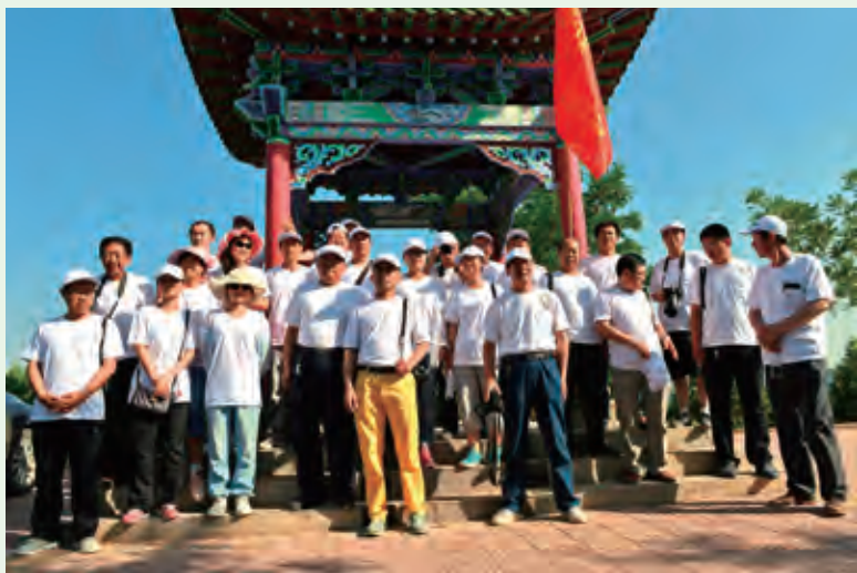
6月6日，子洲县诗词学会举行“子洲八景”采风活动