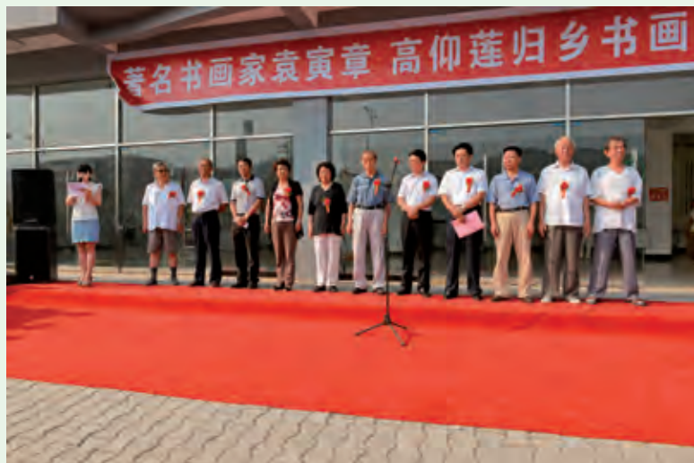
8月15日，著名书画家袁寅章、高仰莲归乡书画展在子洲县城举行