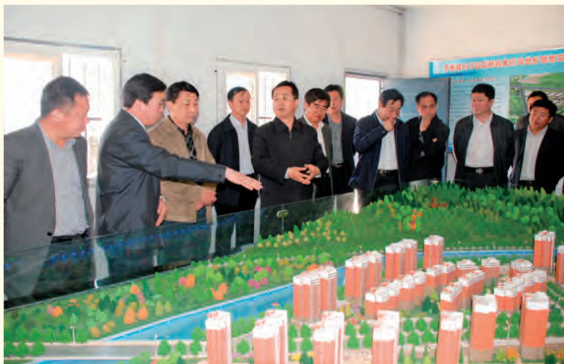
4月26日，榆林市政府市长陆治原来子洲县调研