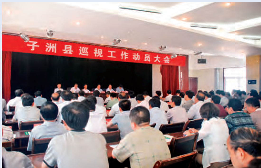
6月4日，子洲县召开巡视工作动员会。省委第一巡视组组长吴登昌及巡视组成员出席会议，巡视组副组长郝宗友作动员讲话