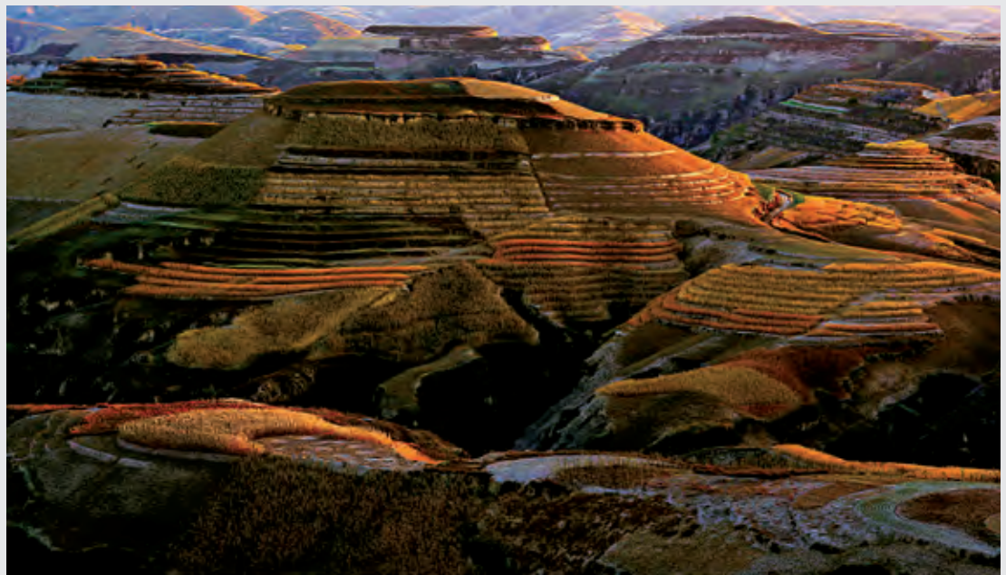
壮美黄土地