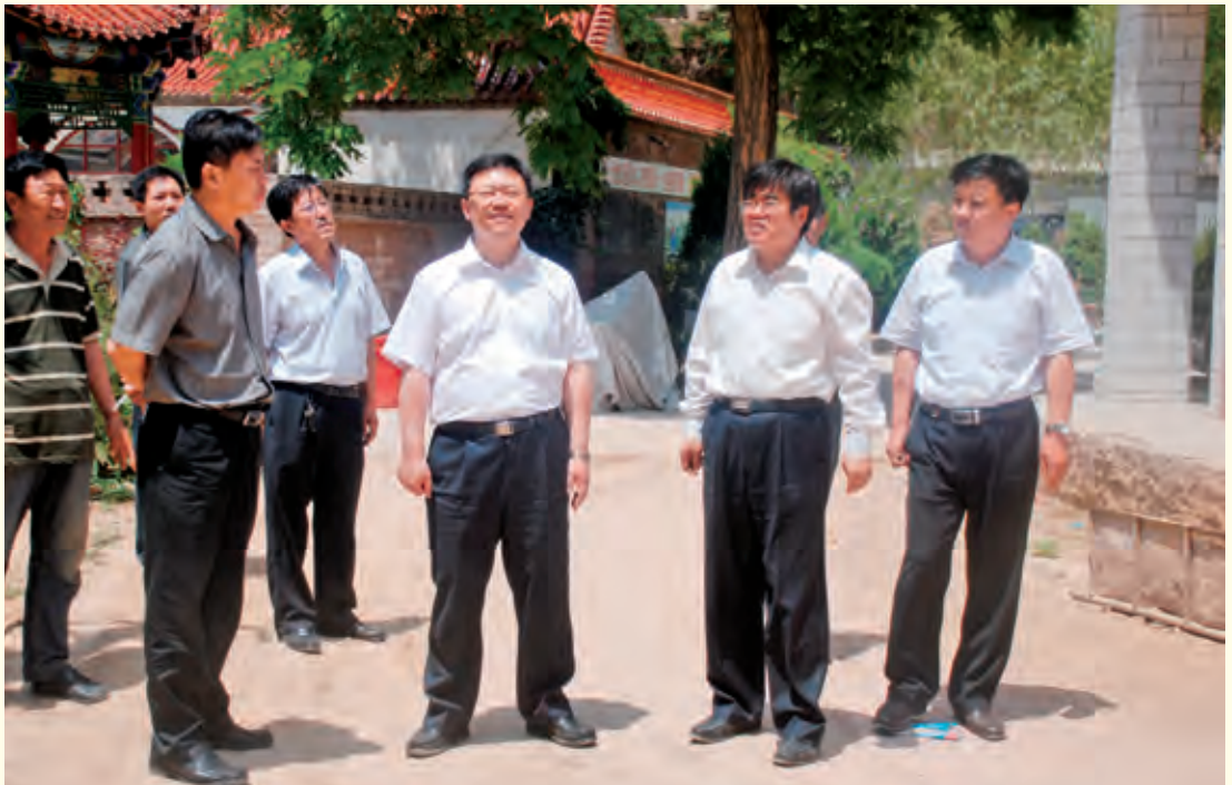
6月8日，市委常委、组织部长尉俊东来子洲县调研党的群众路线教育实践活动