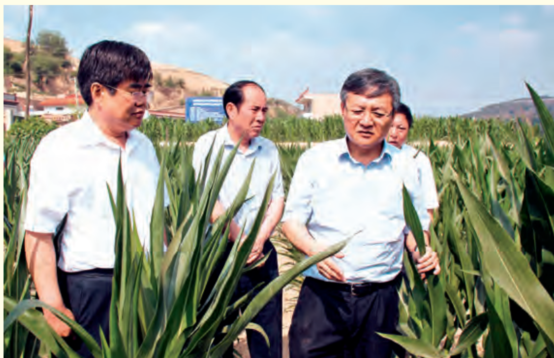
6月30日，副省长祝列克来子洲县调研农业工作