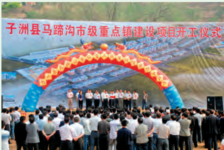
5月25日，总建筑面积5万平方米的马蹄沟市级重点镇建设项目动工兴建