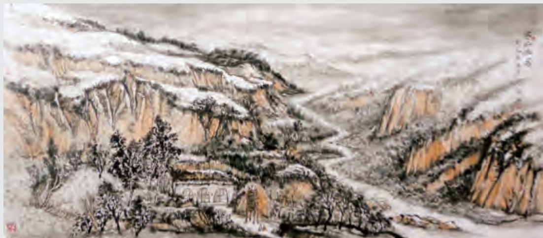
寒山幽居（国画） 许飞