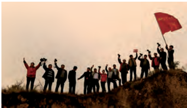
“金秋双湖，秀美山川”采风团在克戎寨合影

子洲县文联自 2011 年 3 月成立以来，在县委、县政府的正确领导下，在市文联的指导下，认真学习贯彻党的十八大、十八届三中全会精神及习近平总书记关于文艺发展的重要指示，牢记肩负的责任和使命，紧紧围绕全县的工作重心，深入开展党的群众路线教育实践活动，努力践行社会主义核心价值观，积极投身文艺发展第一线，认真开展各种丰富多彩的文艺活动，大力宣传党的路线、方针、政策，为繁荣文艺事业，推进“实力子洲、幸福子洲”建设提供了精神动力和文化支持。