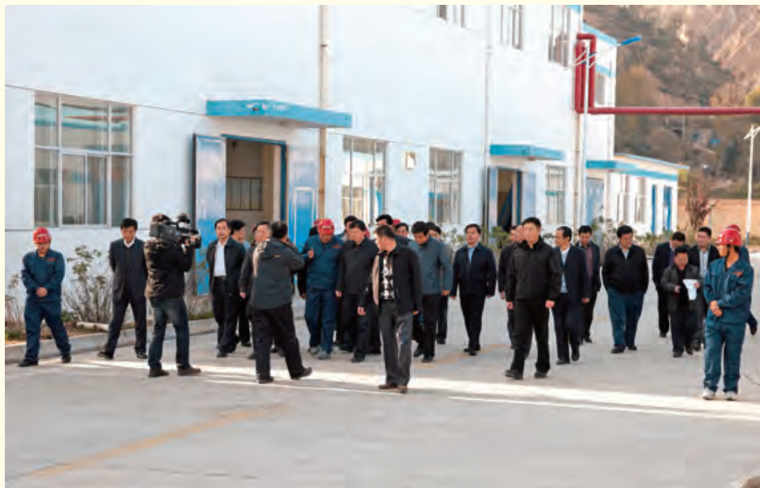
10月25日，省长娄勤俭来子洲县调研