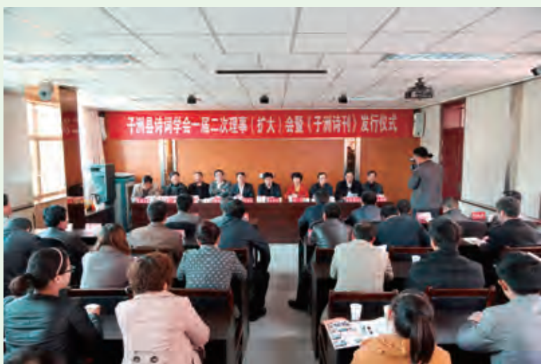
3月19日，子洲县诗词学会举行《子洲诗刊》发行仪式