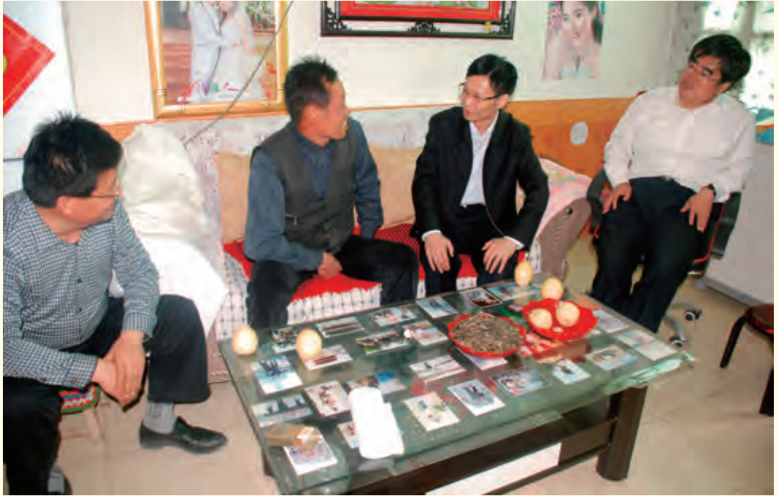
5月7日，副市长张海峰在子洲县裴家湾镇后小沟村党建联系点调研群众路线教育实践活动