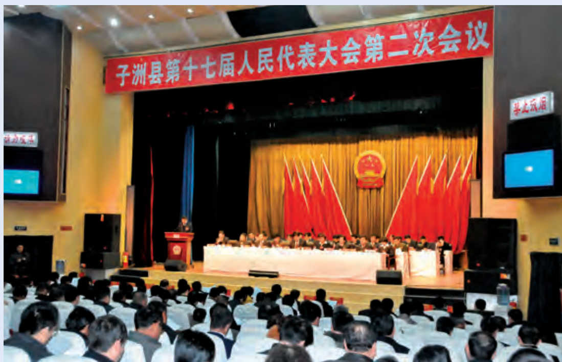
2月27日，县十七届人民代表大会第二次会议在庄严的国歌声中拉开帷幕