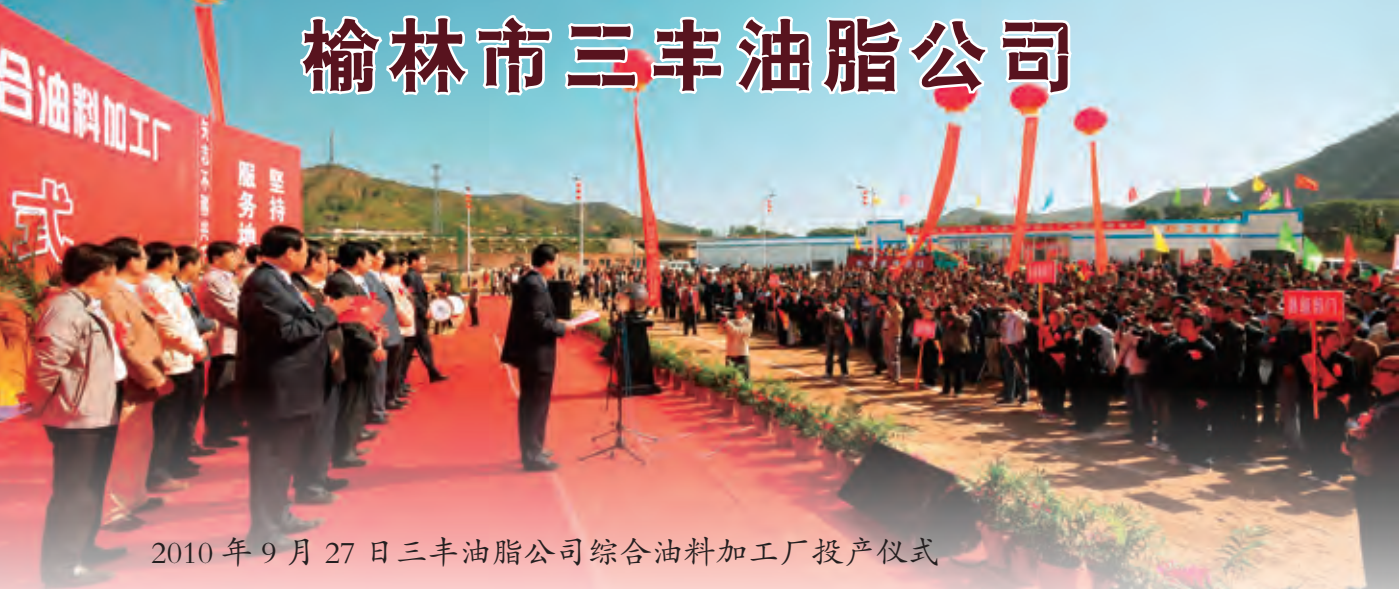
2010年9月27日三丰油脂公司综合油料加工厂投产仪式