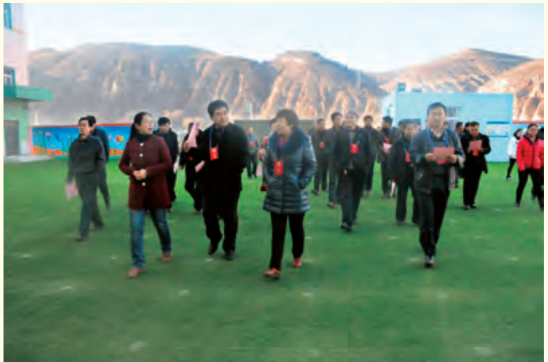
11月28日，县 人大代表视察重点项 目建设工程