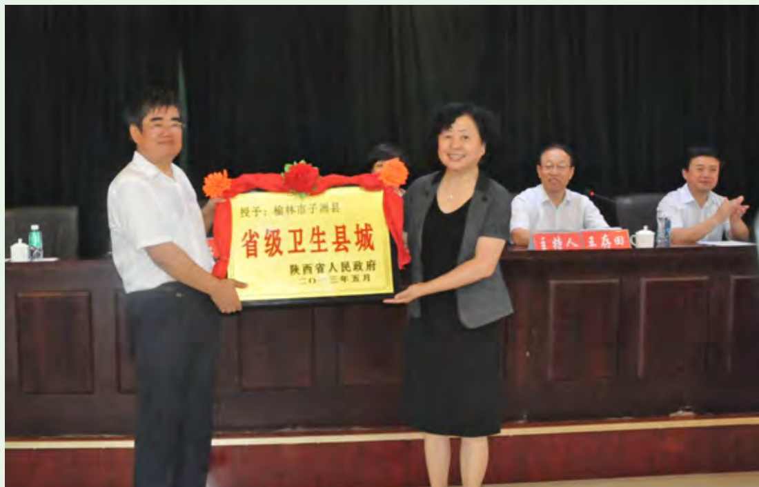
7月18日，省卫生厅巡视员习红向子洲县授省级卫生城市牌匾