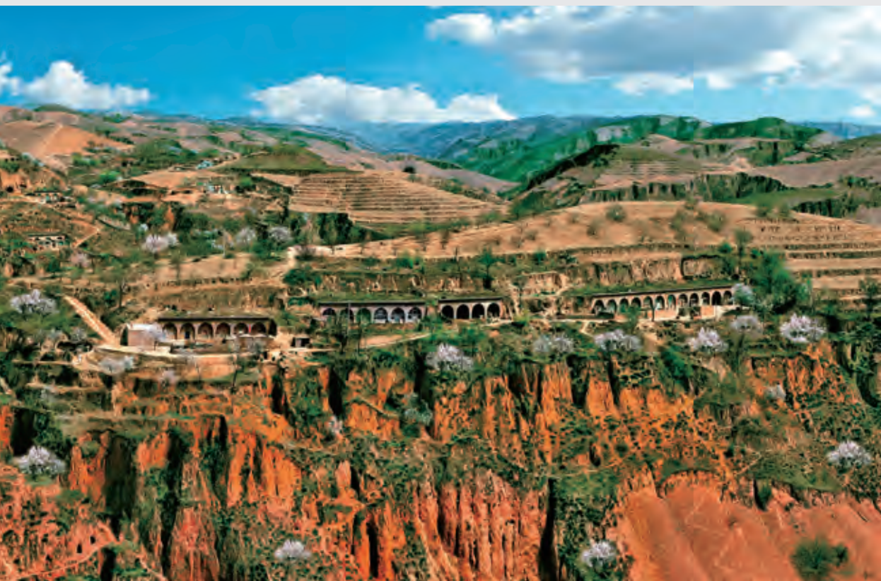
山村春色 高雄奇摄