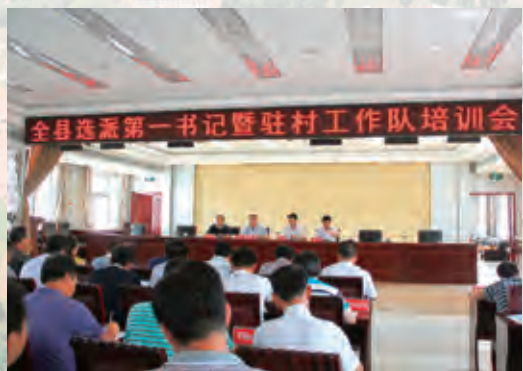
“第一书记”暨驻村工作队培训会