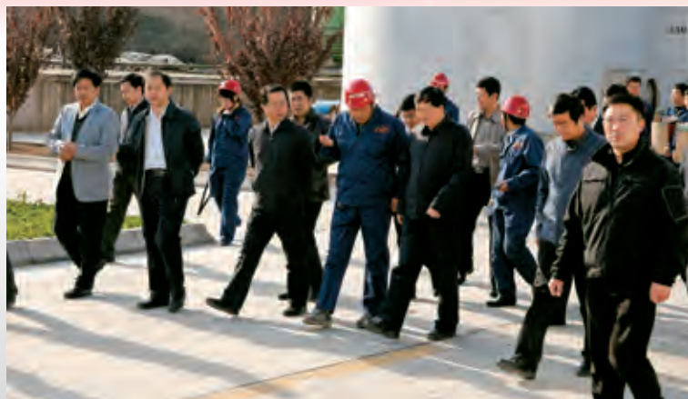
2013年10月25日，省长娄勤俭来公司调研