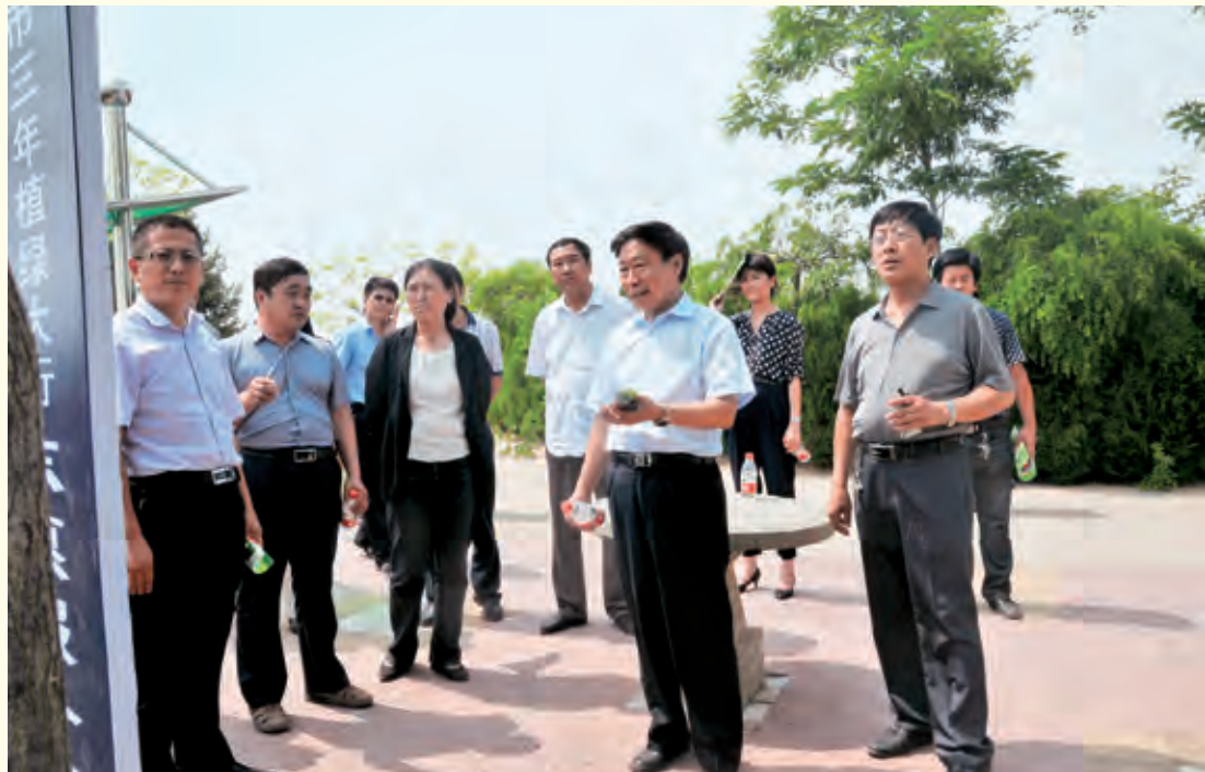
6月5日，中国志愿服务基金会副理事长曹分田来子洲县调研