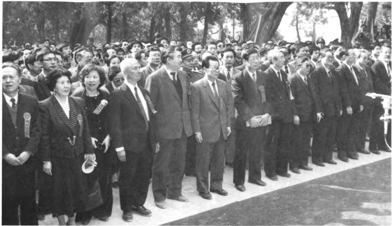
一九九四年清明节，李瑞环同志与海内外同胞 一起参加公祭黄帝陵典礼。